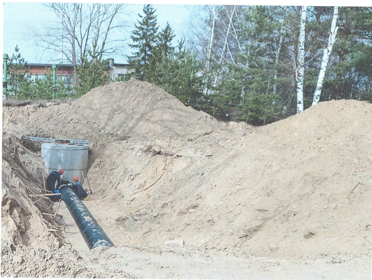
Прокладка внутриплощадочных сетей фильтровальной воды ПВОС