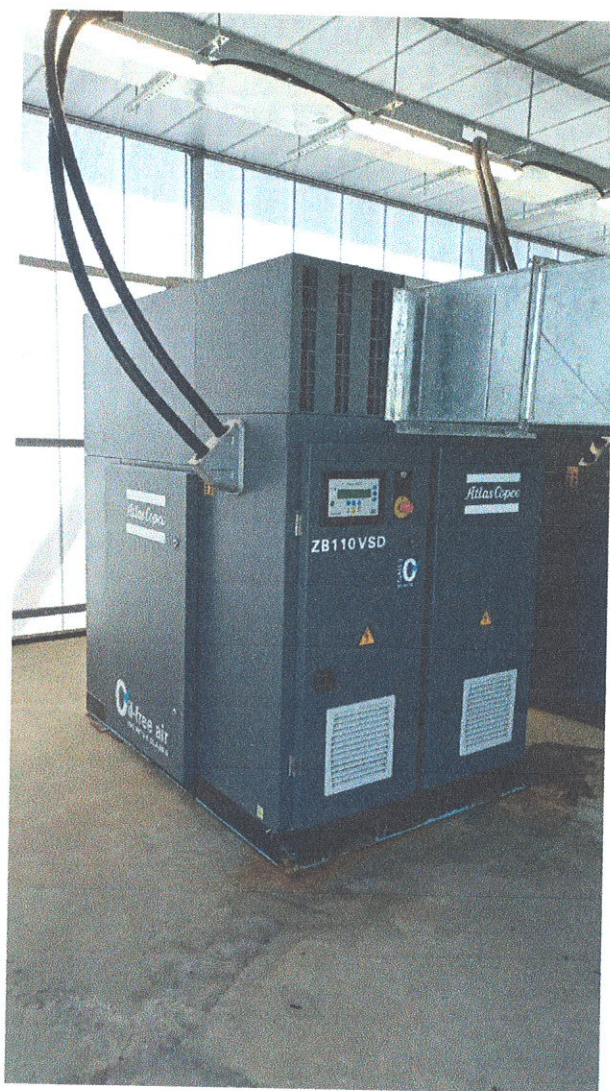
Агрегат воздуходувный с обвязкой №5