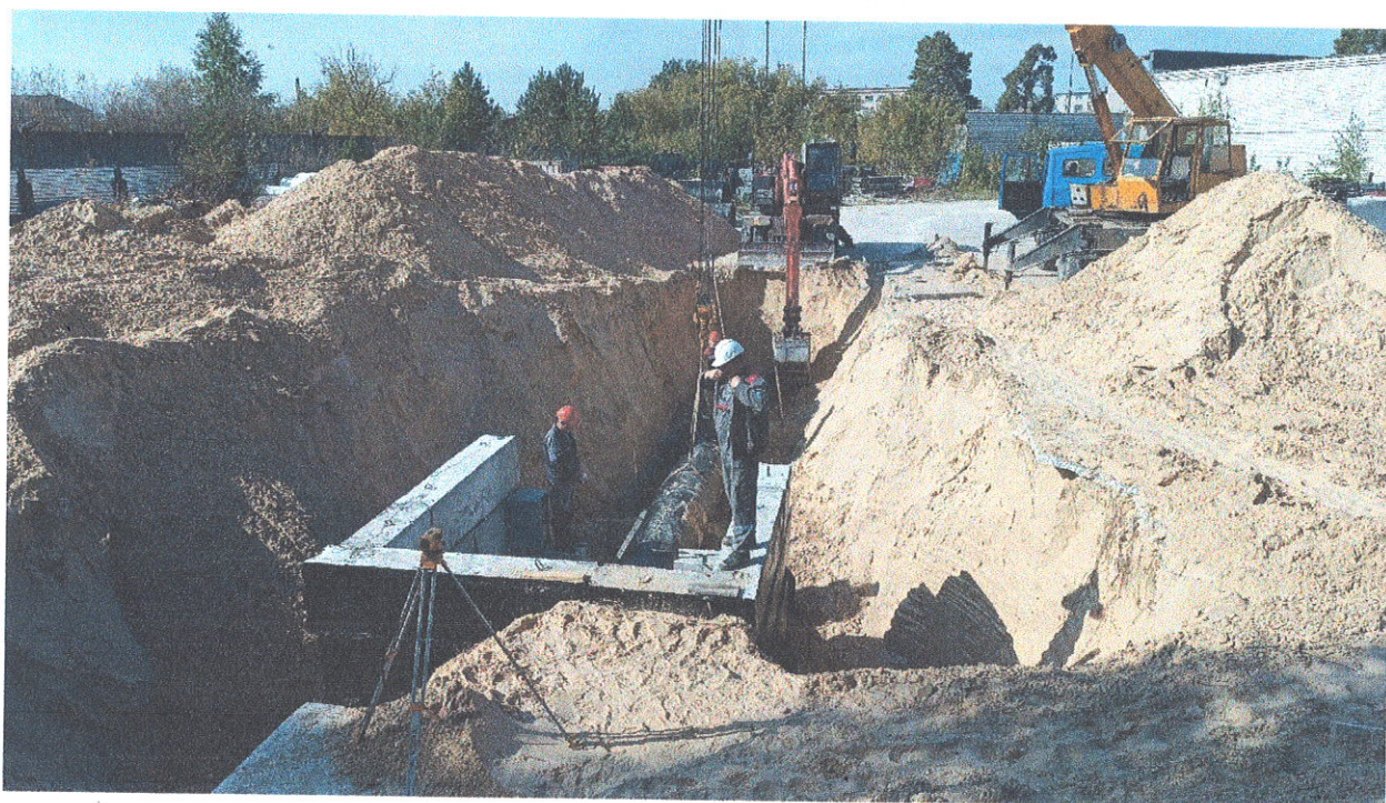
Строительство участка второй нитки Тепловского водозабора на территории производственной площадки АО «ДВК» по адресу: пр. Дзержинского, 43 (подключение к внутриплощадочным сетям)