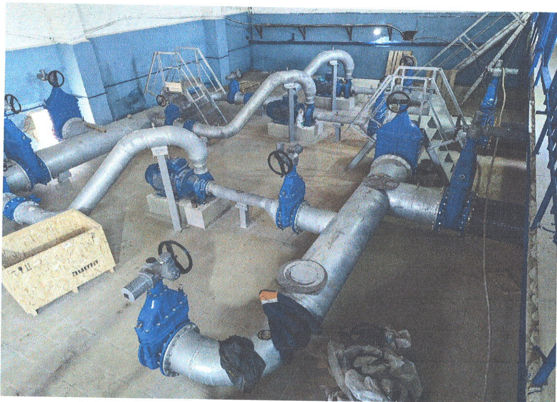
Установка насосного оборудования с трубопроводами и запорной арматурой (здание №629 ПВОС)