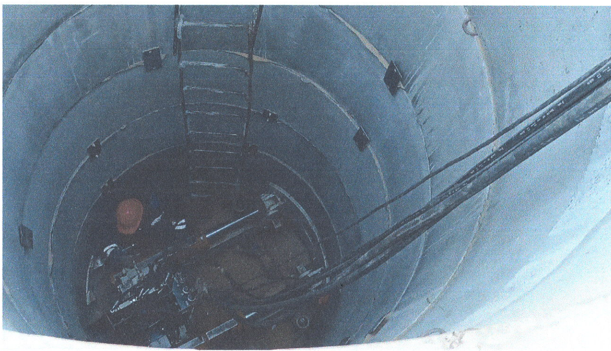
Реконструкция (санация) канализационного коллектора по ул. Самохвалова