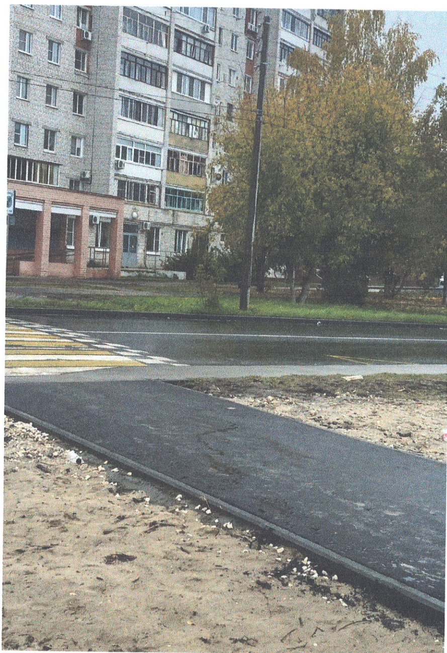
Благоустройство территории после прокладки главного канализационного коллектора, участок ул. Р. Удриса д.11 до ул. Терешковой д.4)