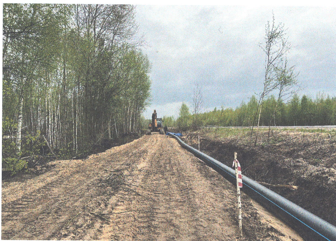
Прокладка водопровода DN315 от повысительной насосной станции №3 промышленного парка «ДЗЕРЖИНСК-ВОСТОЧНЫЙ» до производственной площадки индустриального парка (II очередь ОЭЗ ПШТ «КУЛИБИН»)