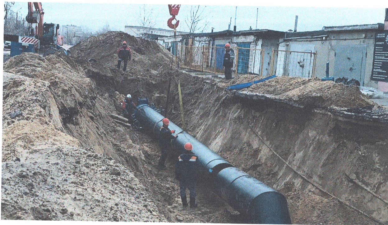
Прокладка трубопровода ул. Студенческая, 59 - пр. Ленина, 105 (участок 14 от ВК-123-4 до ВК-130-24а)