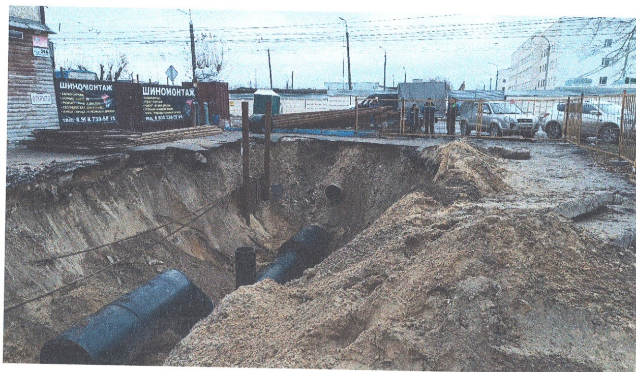
Прокладка трубопровода ул. Студенческая, 59 - пр. Ленина, 105 (участок 14 от ВК-123-4 до ВК-130-24а)