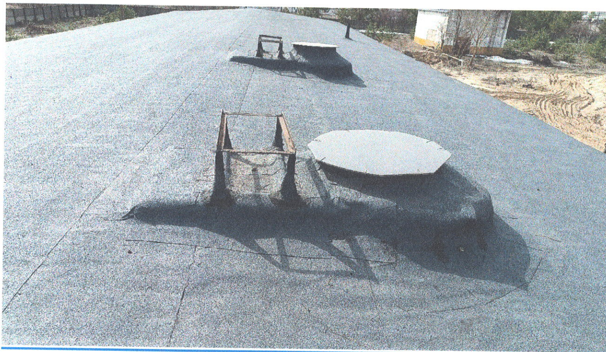
Ремонт кровли на насосной станции (здание №629 производственное, ул. Сухаренко, 10 (инв.№5249))