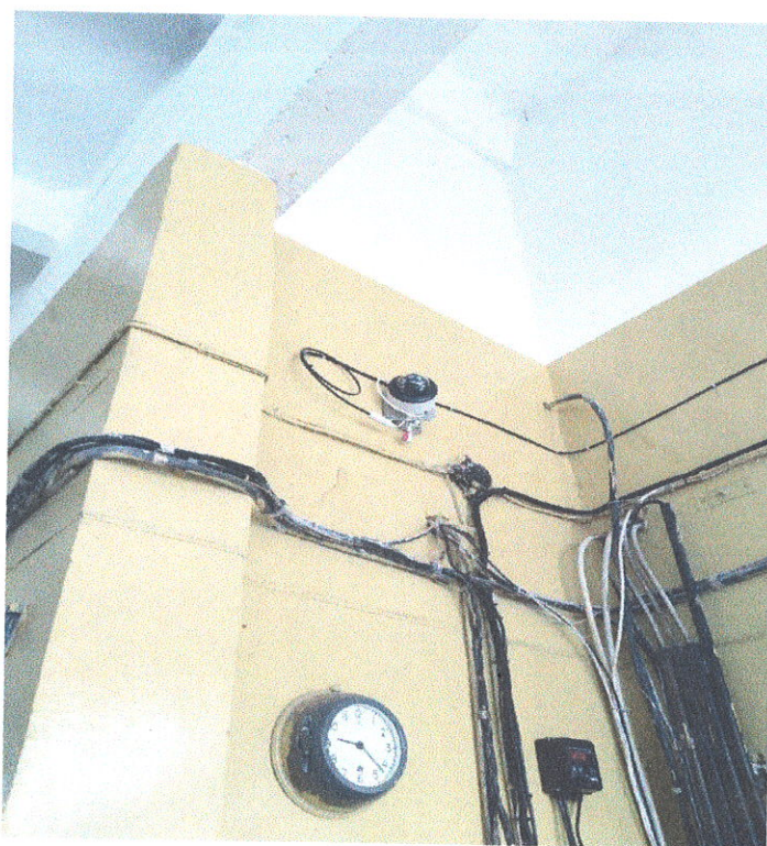
Камеры видеонаблюдения на критическом элементе объекта водоотведения