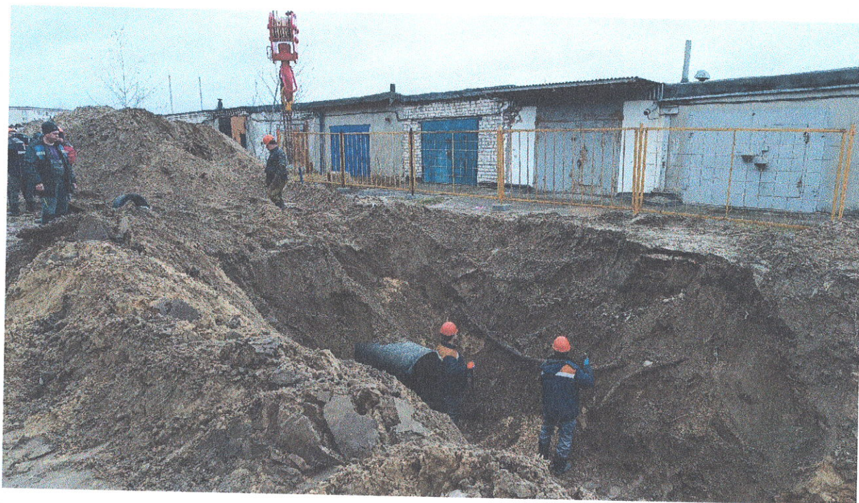
Прокладка трубопровода ул. Студенческая, 59 - пр. Ленина, 105 (участок 14 от ВК-123-4 до ВК-130-24а)