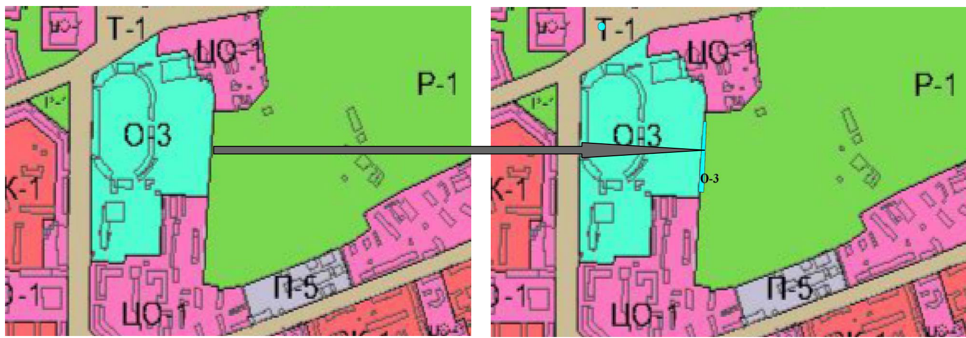
— - условные границы проектируемой зоны

ПРЕДЛОЖЕНИЕ ПО ИЗМЕНЕНИЮ частично границы зоны Р-1-зона зеленых насаждений общего пользования на Парковой Аллее на зону О-3-зона спортивных и спортивно-зрелищных сооружений