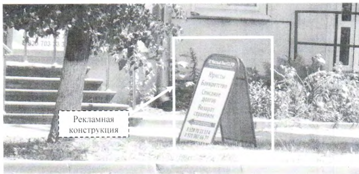
Фото № 2: Панорамный вид размещения рекламной конструкции (сторона Б)