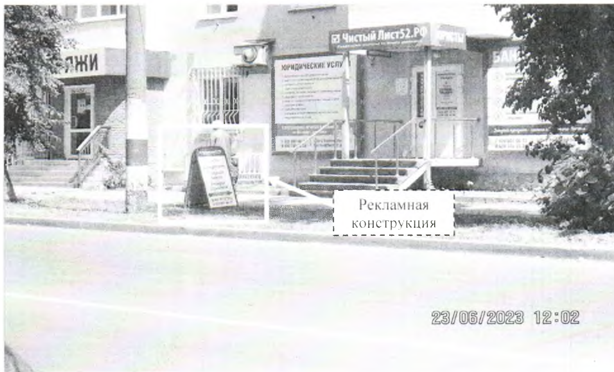
Фото № 1: Панорамный вид размещения рекламной конструкции (сторона А)

Фотофиксация рекламной конструкции размером 1.2 x 0.6 м с эскизным изображением «Чистый Лист 52.РФ Юристы Банкротство Списание долгов Возврат страховок 8 930 70 33 33 4, 8 920 007 66 77», расположенной по адресу: г. Дзержинск, ул. Грибоедова, в районе д. 23/10.