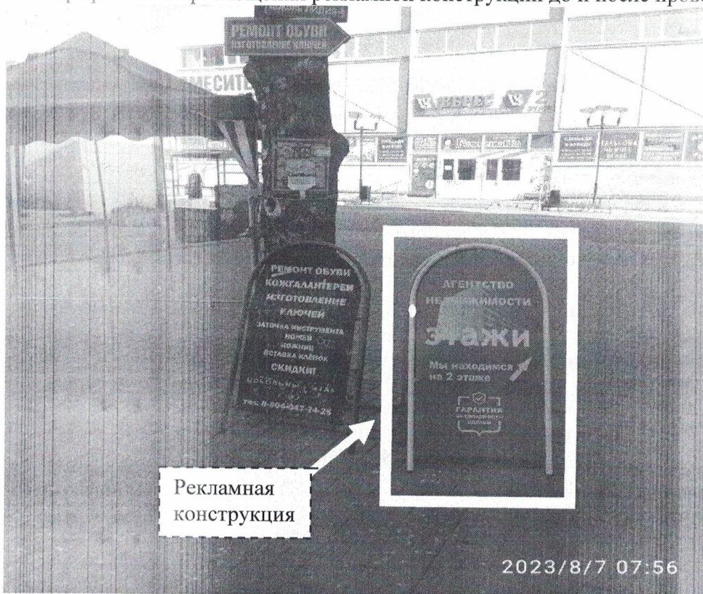
Фото №1: ул.Гайдара, в районе д.59Е – до проведения работ по демонтажу.

Фотографии места размещения рекламной конструкции до и после проведения работ: