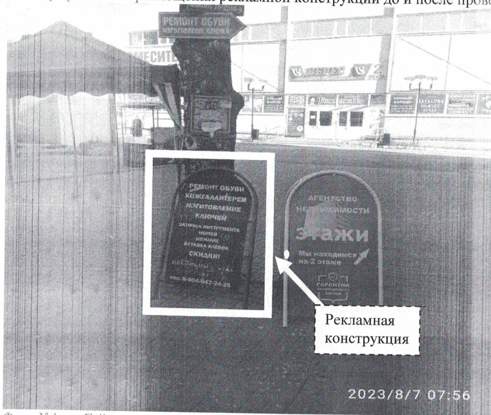
Фото №1: ул.Гайдара, в районе д.59Е – до проведения работ по демонтажу.

Фотографии места размещения рекламной конструкции до и после проведения работ: