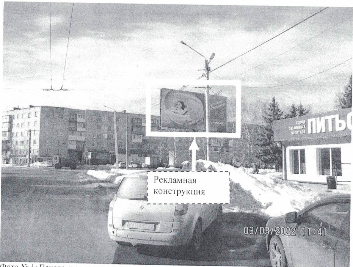
Фото № 1: Панорамное размещение рекламной конструкции.

Фотофиксация места установки (размещения) рекламной конструкции с эскизным изображением «Сторона А: Подарочные сертификаты в продаже Сторона Б: Женский клуб www.luxwellnes.ru Парковая аллея, д.ба +79503750705, (8313)244-144 Кедровая бочка»