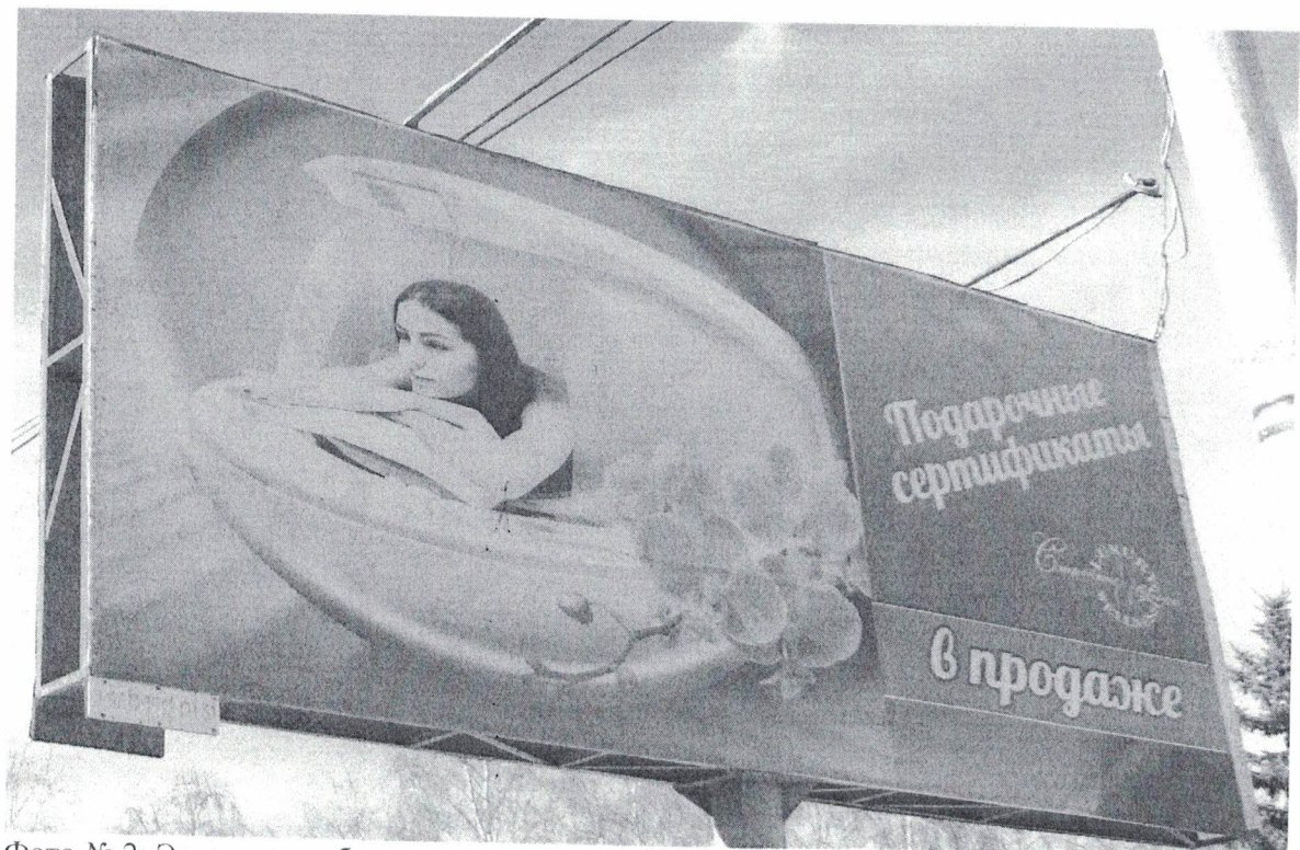
Фото № 2: Эскизное изображение рекламной конструкции, Сторона А.