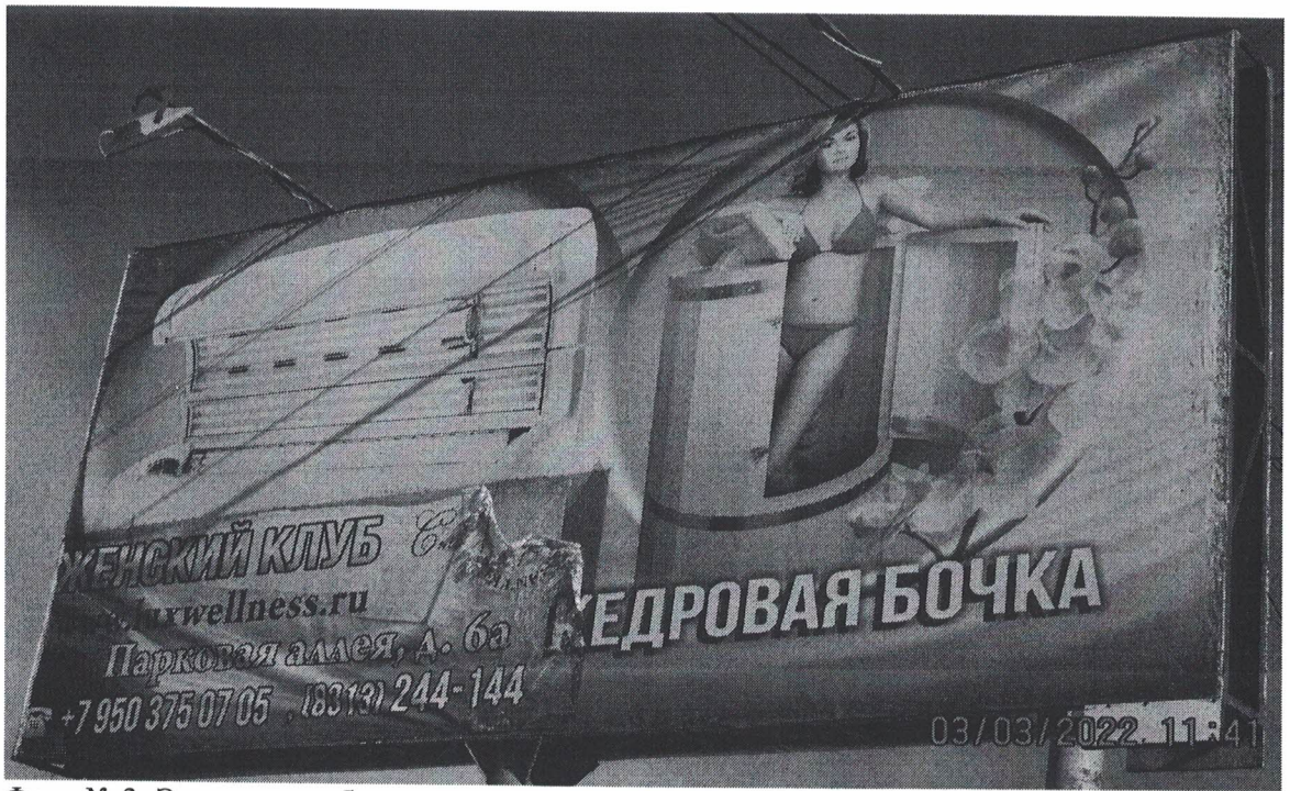
Фото № 3: Эскизное изображение рекламной конструкции, Сторона Б.