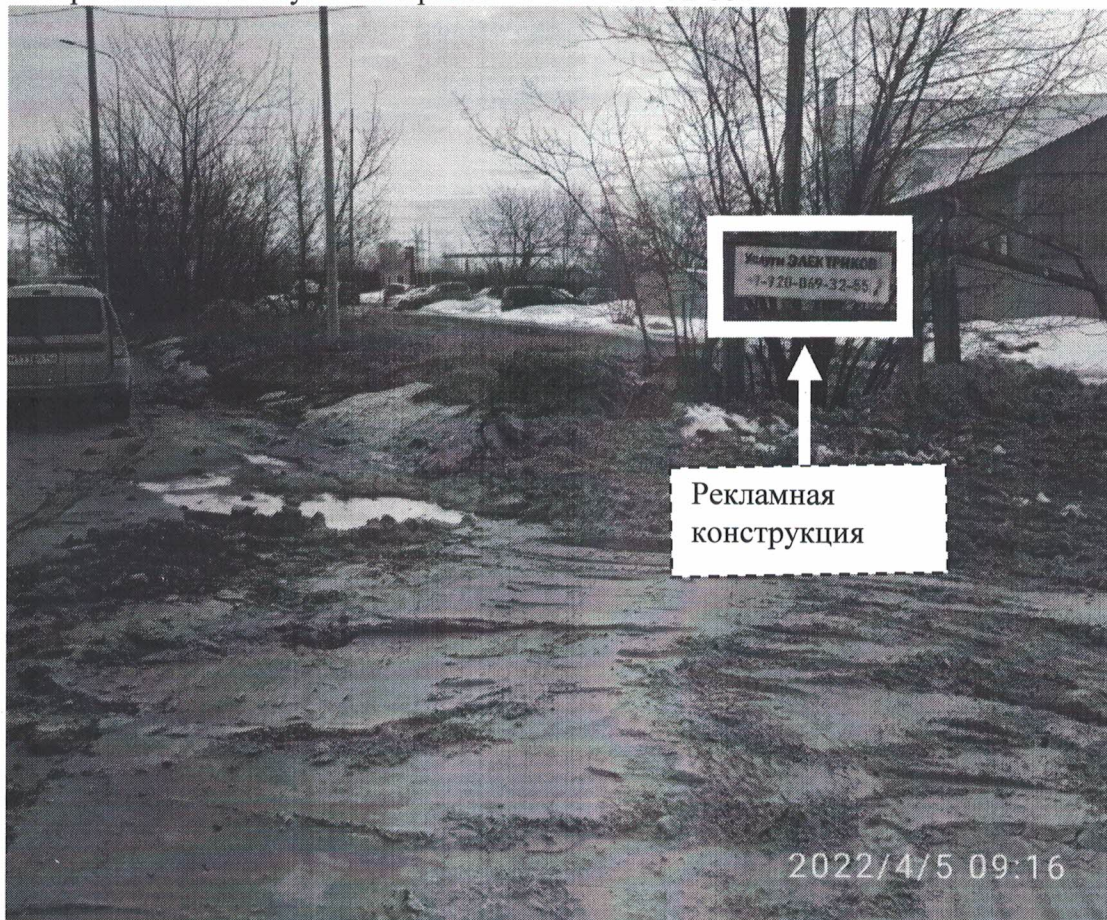
Фото № 1: Панорамное фото размещения рекламной конструкции

Фотофиксация места установки (размещения) рекламной конструкции с эскизным изображением «Услуги электриков +7-920-069-32-55»