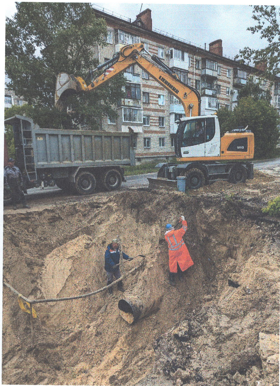
Прокладка трубопровода ул. Студенческая, 59 - пр. Ленина, 105 (участок 14)