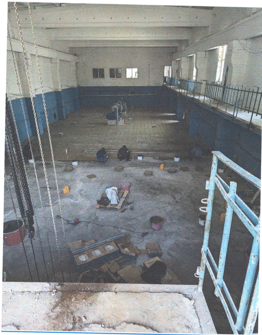
Ведутся работы по укладке напольной плитки в здании №629 производственное, ул. Сухаренко, 10 (инв.№5249)