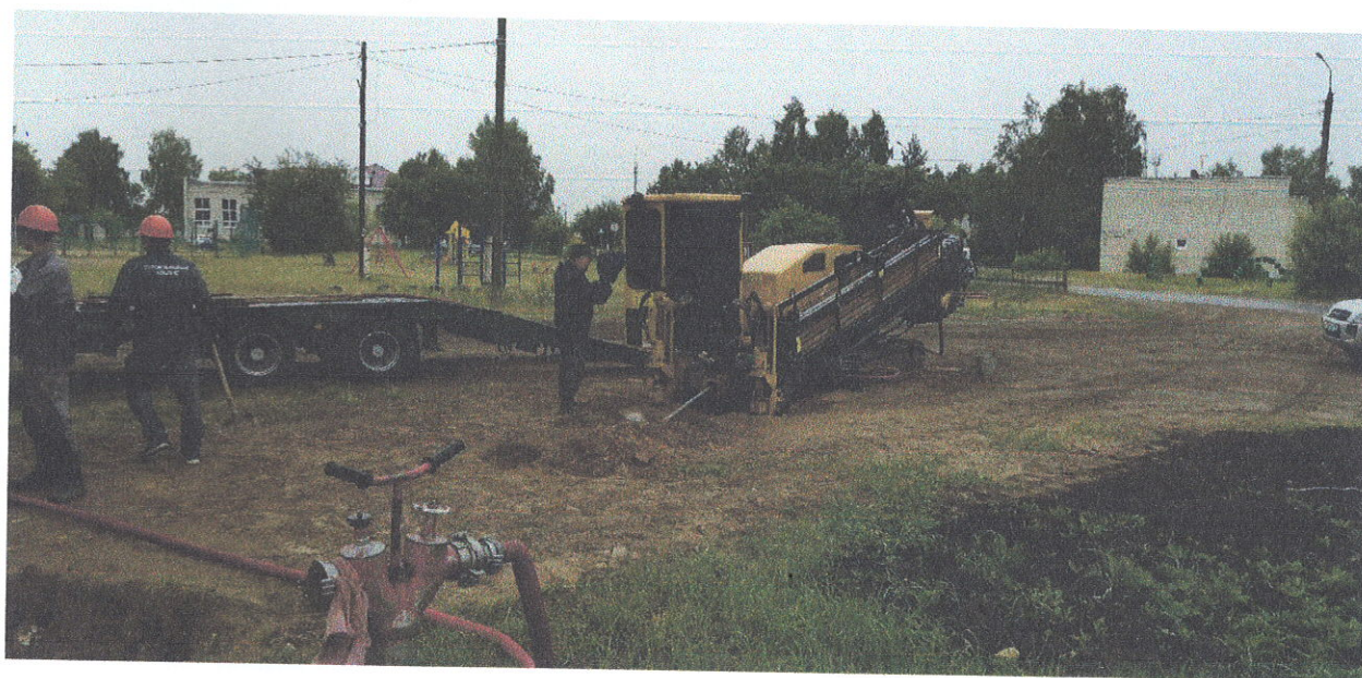
Прокладка трубопровода закрытым способом в рабочем поселке Пыра