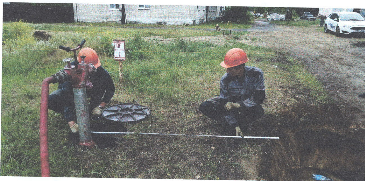
Прокладка сетей водоснабжения рабочего поселка Пыра