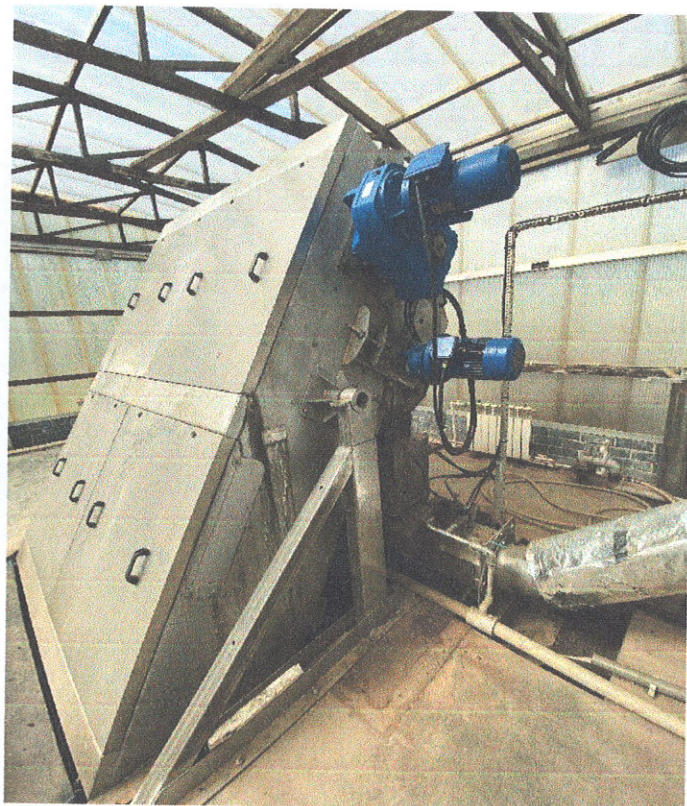
Решетка с перфорированным экраном и прессом винтовым промывочным