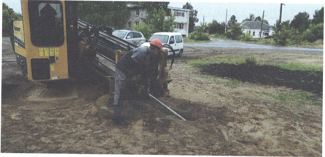
Прокладка трубопровода закрытым способом в рабочем поселке Пыра