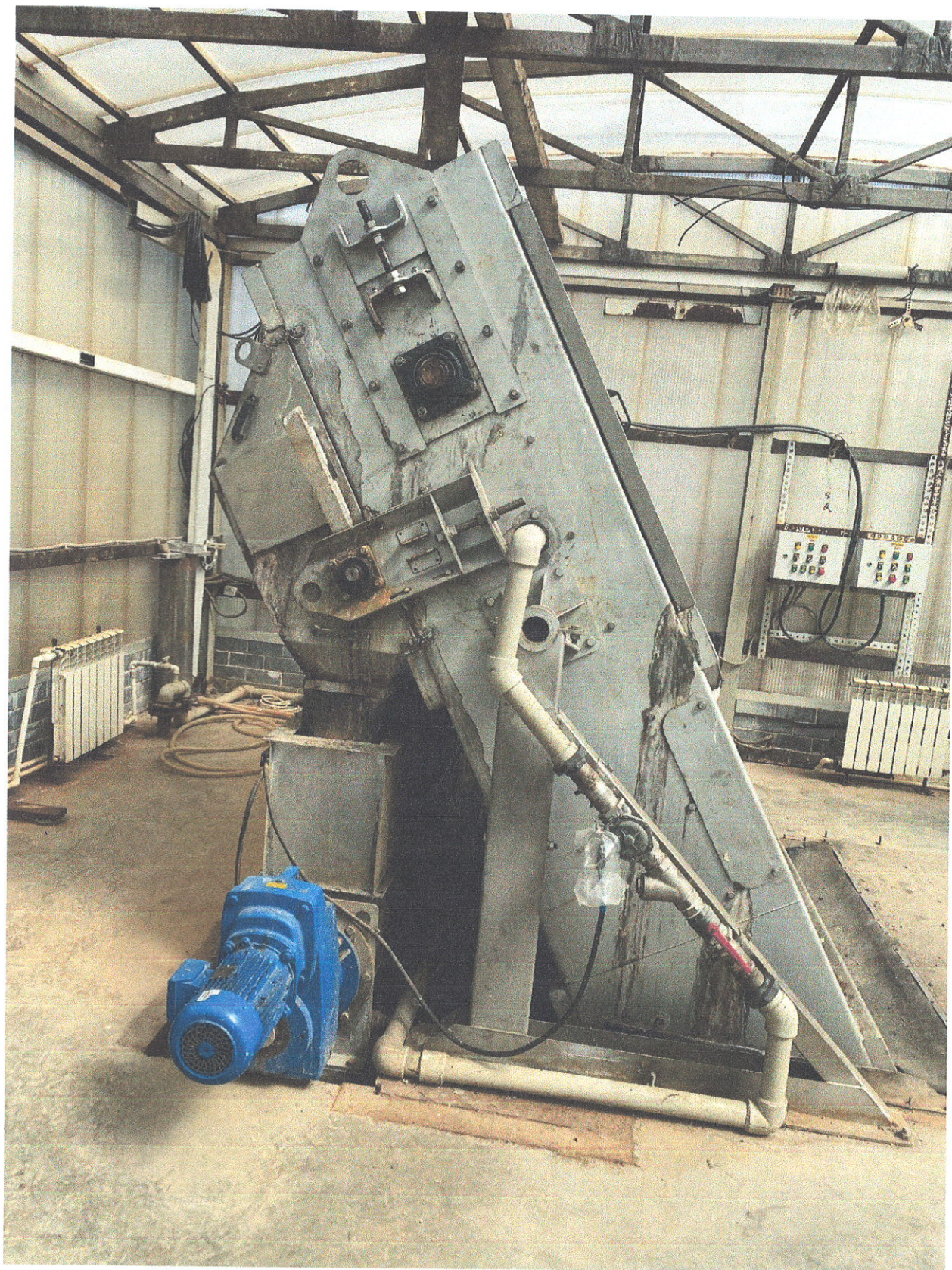
Монтаж решетки с перфорированным экраном и прессом винтовым промывочным