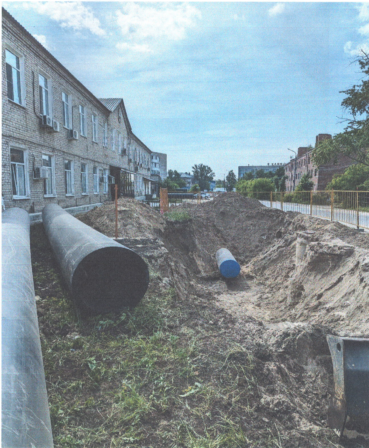
Прокладка трубопровода ул. Студенческая, 59 - пр. Ленина, 105 (участок 14)