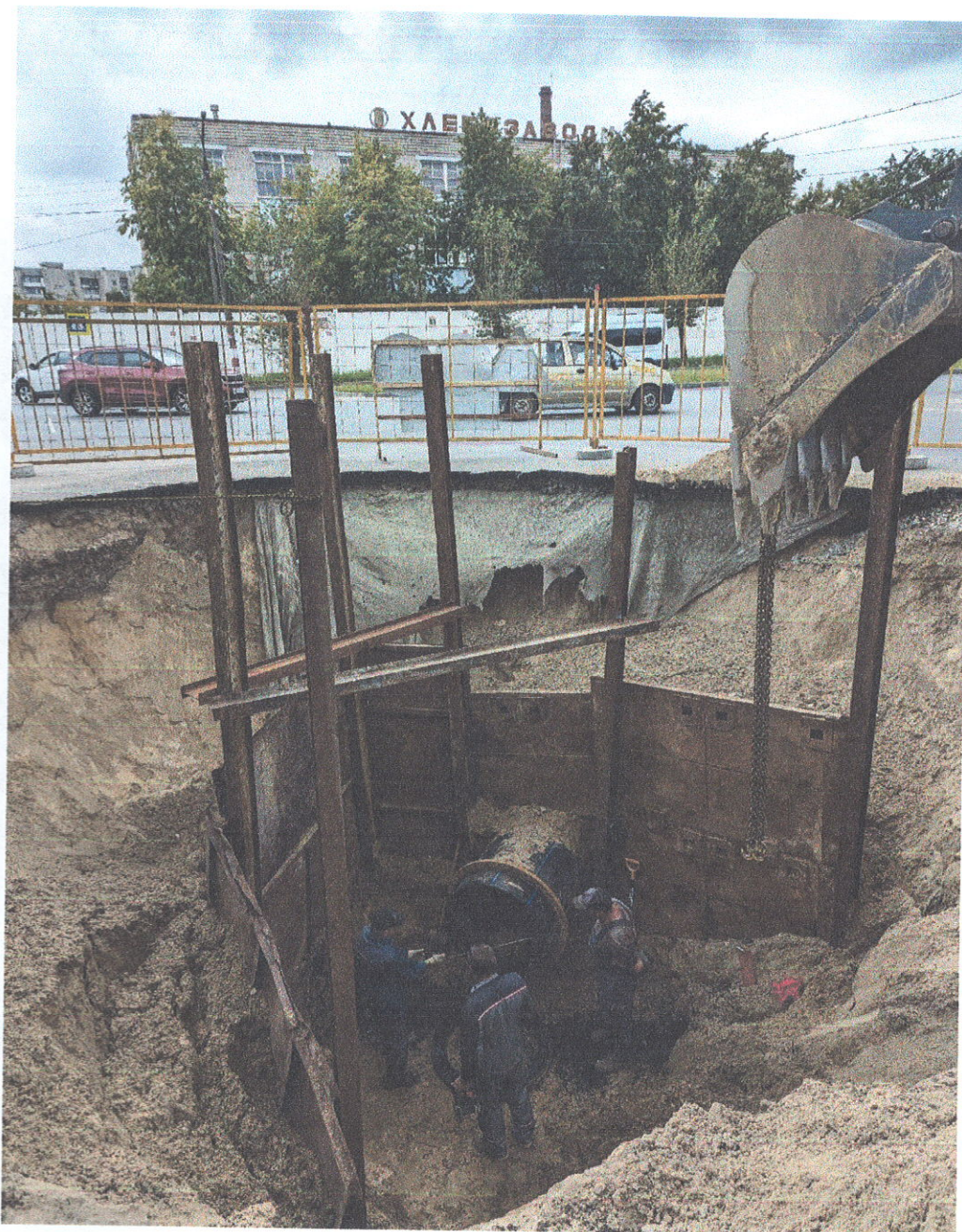
Возле р. Волга Прокладка трубопровода ул. Студенческая, 59 - пр. Ленина, 105 (участок 14)