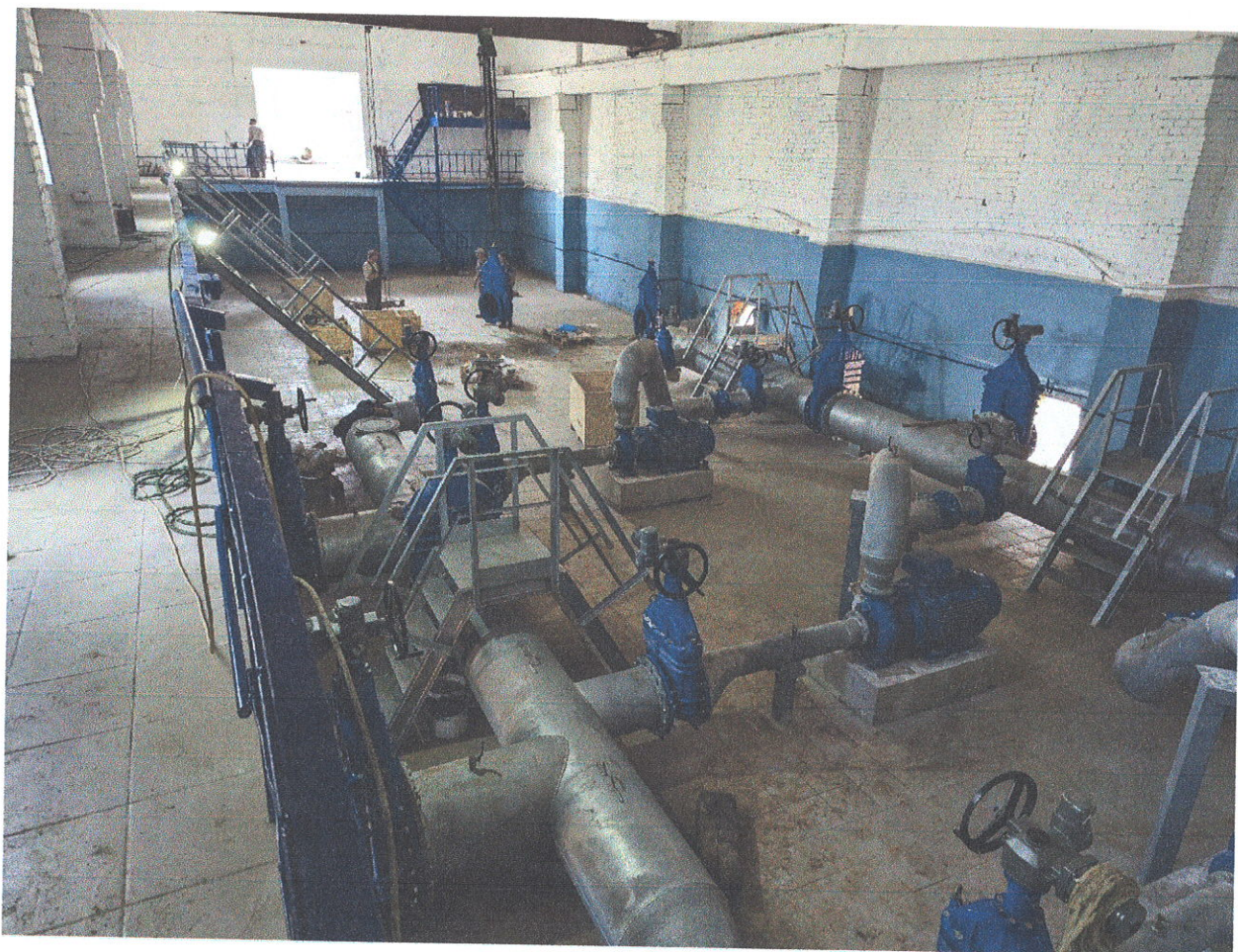
Прокладка внутриплощадочных сетей фильтрованной воды ПВОС