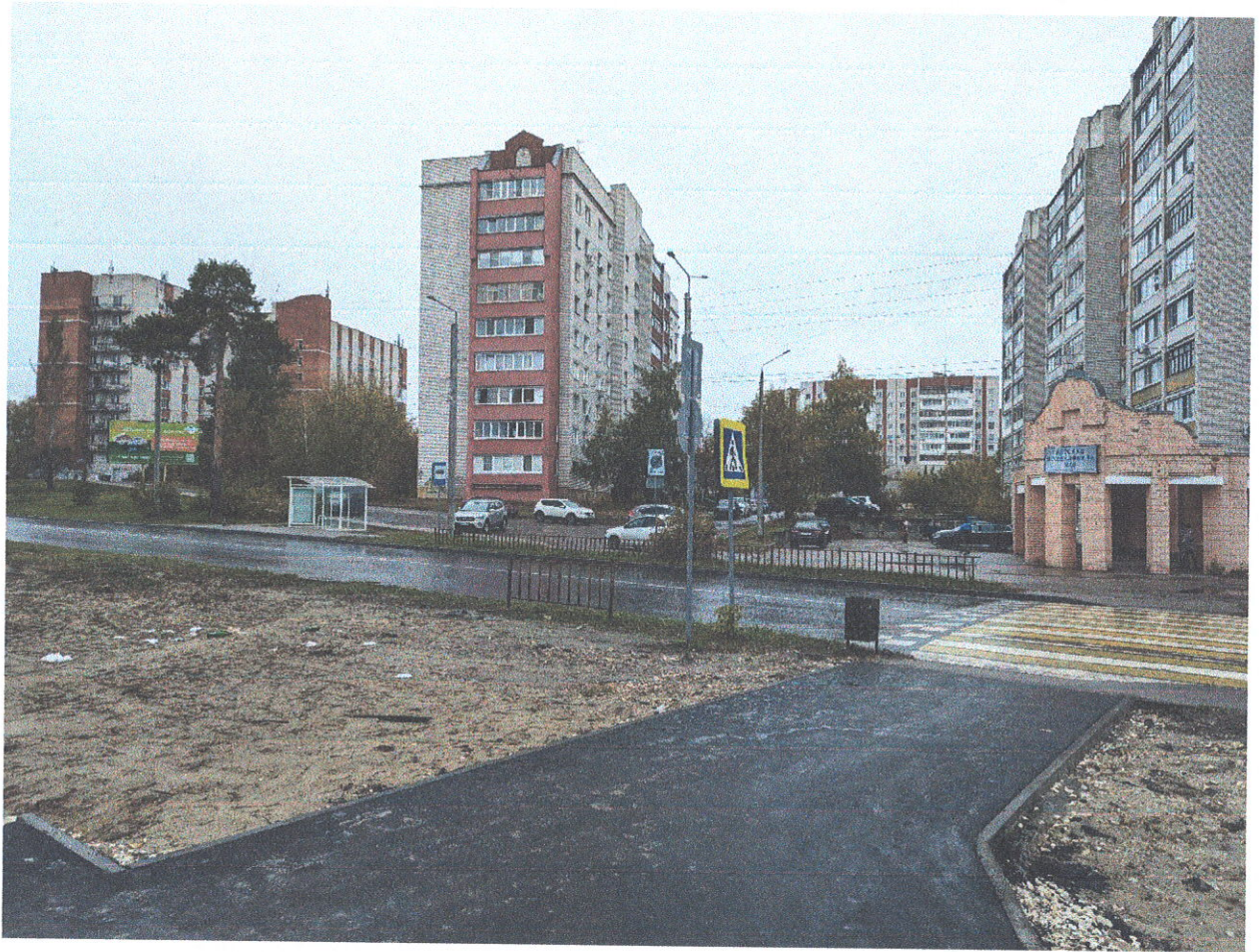
Благоустройство территории после прокладки главного канализационного коллектора