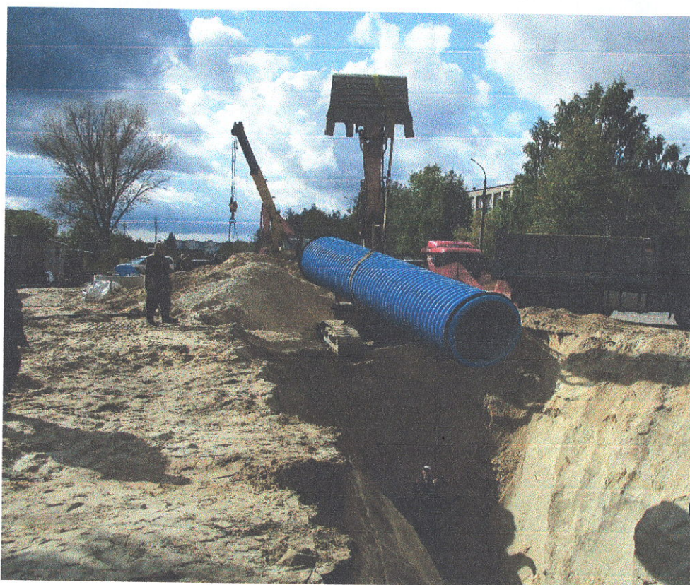
Главный канализационный коллектор, участок ул. Р. Удриса д.11 до ул. Терешковой д.4)