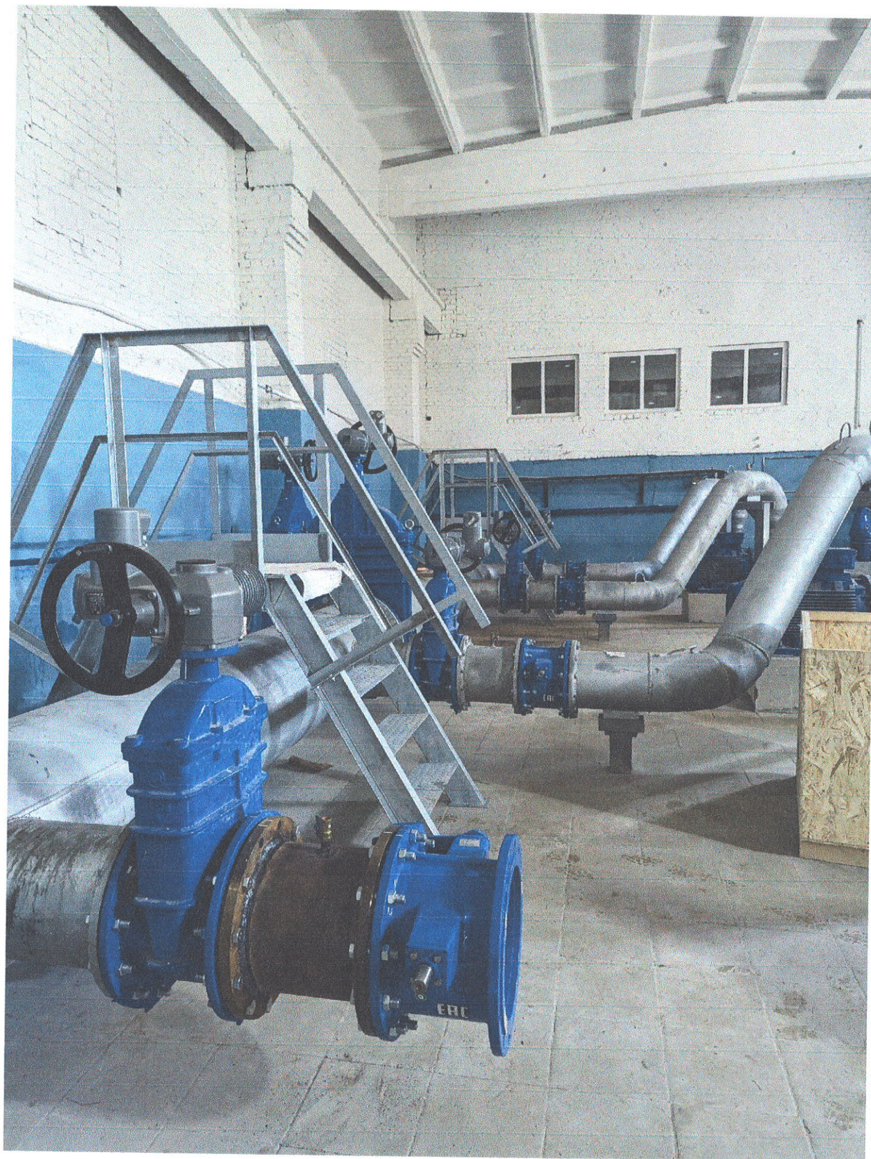
Прокладка внутриплощадочных сетей фильтрованной воды ПВОС