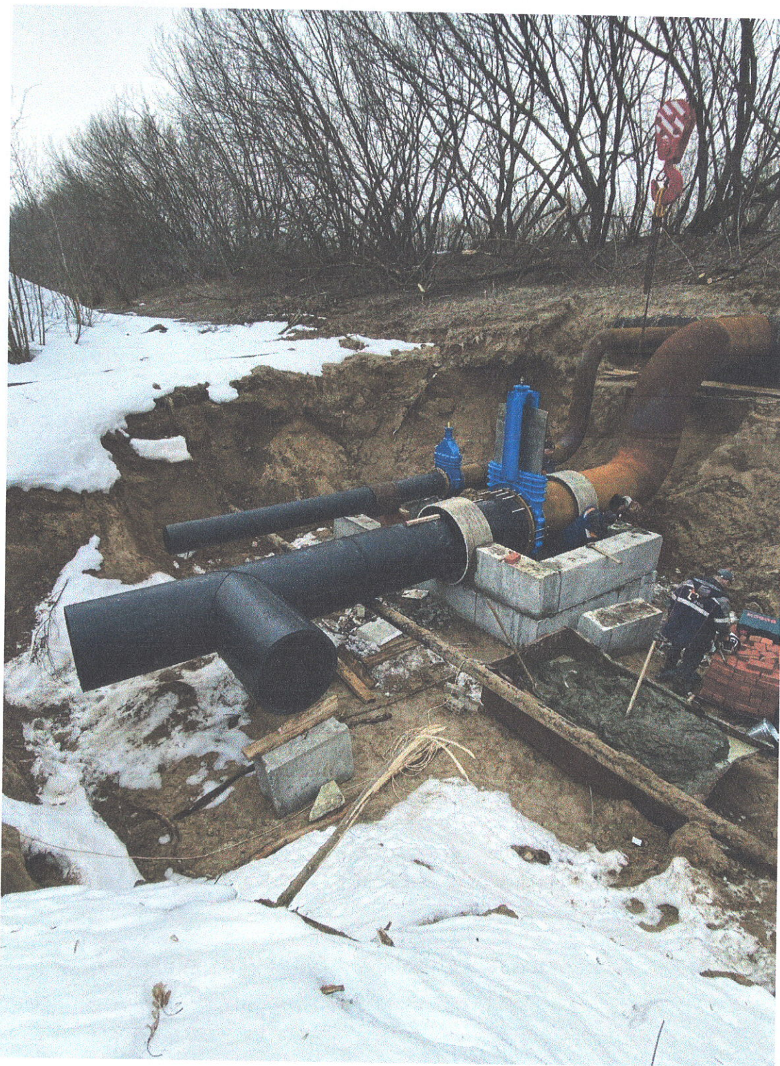
Создание аварийного сброса из коллектора К1 №3