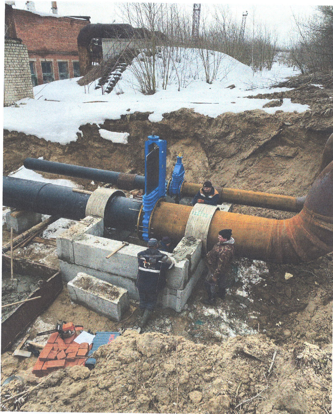
Создание аварийного сброса из коллектора К1 №3