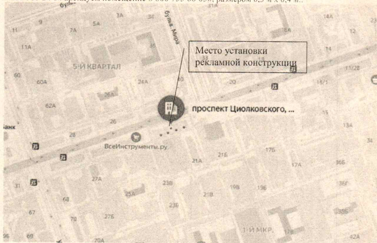
Схема установки (размещения) рекламной конструкции оранжевого цвета с эскизным изображением «Аптека ВИТА экспресс аптечный пункт 8 – 20 без выходных 8 800 755 00 03000 Селена» Общество с ограниченной ответственностью «Селена», 603135, Нижегородская обл., г.Нижний Новгород, пр-т Ленина, дом№61, помещение Вп3 Офис 48 приглашаем на работу 8 800 500 24 84 арендуем помещение 8 800 755 00 03», размером 0,3 м x 0,4 м.: