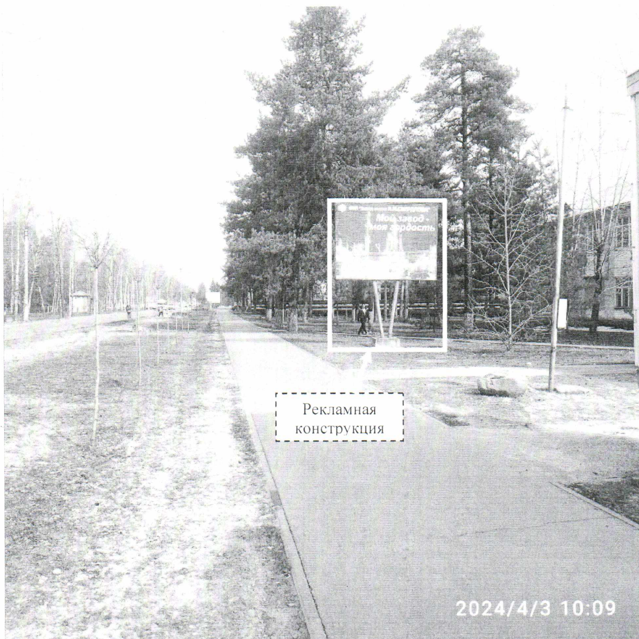
Фото № 1: Панорамный вид размещения рекламной конструкции (сторона А)

Фотофиксация рекламной конструкции размером 4,0 x 3,0 м с эскизным изображением на стороне А: «ФКП «Завод имени Я.М. Свердлова» Мой завод - моя гордость», на стороне Б: «ФКП ЗАВОД ИМЕНИ Я.М. СВЕРДЛОВА ОБОРОННЫЙ ЩИТ РОССИИ химическое производство», расположенной по адресу: г. Дзержинск, пр. Свердлова, в районе д. 10.