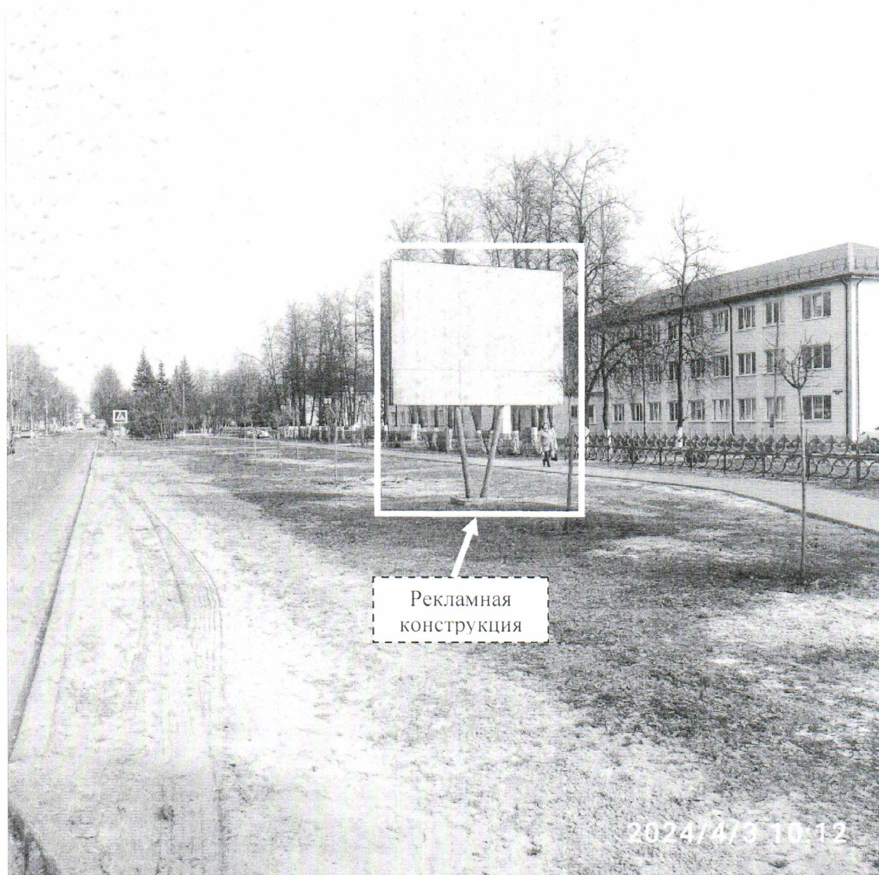
Фото № 1: Панорамный вид размещения рекламной конструкции (сторона А)

Фотофиксация рекламной конструкции размером 4,0 х 3,0 м с эскизным изображением на стороне А: без эскизного изображения, на стороне Б: без эскизного изображения, расположенной по адресу: г. Дзержинск, пр. Свердлова, в районе д. 8.