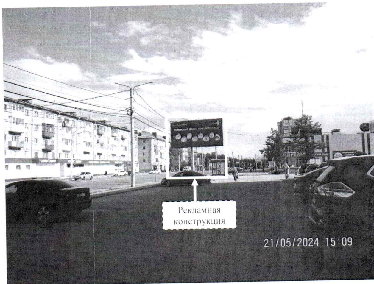
Фото № 1: Панорамный вид размещения рекламной конструкции (сторона А)

Фотофиксация рекламной конструкции размером 6,0 х 3,0 м с эскизным изображением на стороне А: «Тел.: +7 (930) 2 400 400 ИКИГАЙ ПОПРОБУЙ НАШИ НОВЫЕ РОЛЛЫ!», на стороне Б: «ПРОИЗВОДСТВО ЭЛЕКТРОМАТЕРИАЛОВ ДЛЯ ВНЕШНЕЙ И ВНУТРЕННЕЙ ОТДЕЛКИ КАСКАД ДЕКОР ■ ТЕРМОПАНЕЛИ под кирпич/под сайдинг под блок-хаус ■ КАМЕННЫЙ КОВЕР (галька) ■ МРАМОРНАЯ ШТУКАТУРКА ■ МРАМОРНЫЕ ОБОИ ■ ГИБКАЯ ДОСКА ■ ГИБКИЙ КИРПИЧ vk.com/kaskaddekor ОТДЕЛ ПРОДАЖ Г. ДЗЕРЖИНСК, МАРКОВНИКОВА 18а 8 991-191-69 01 8 930-260-30 46», расположенной по адресу: г. Дзержинск, ул. Гайдара, в районе д. 59.