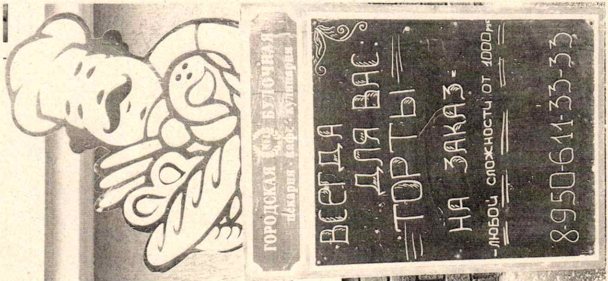
Фото №2: Эскизное изображение рекламной конструкции