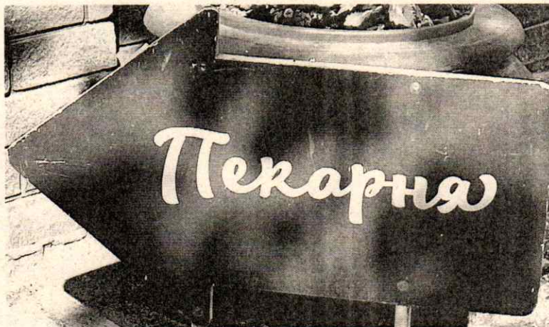
Фото № 2: Эскизное изображение рекламной конструкции (сторона А)