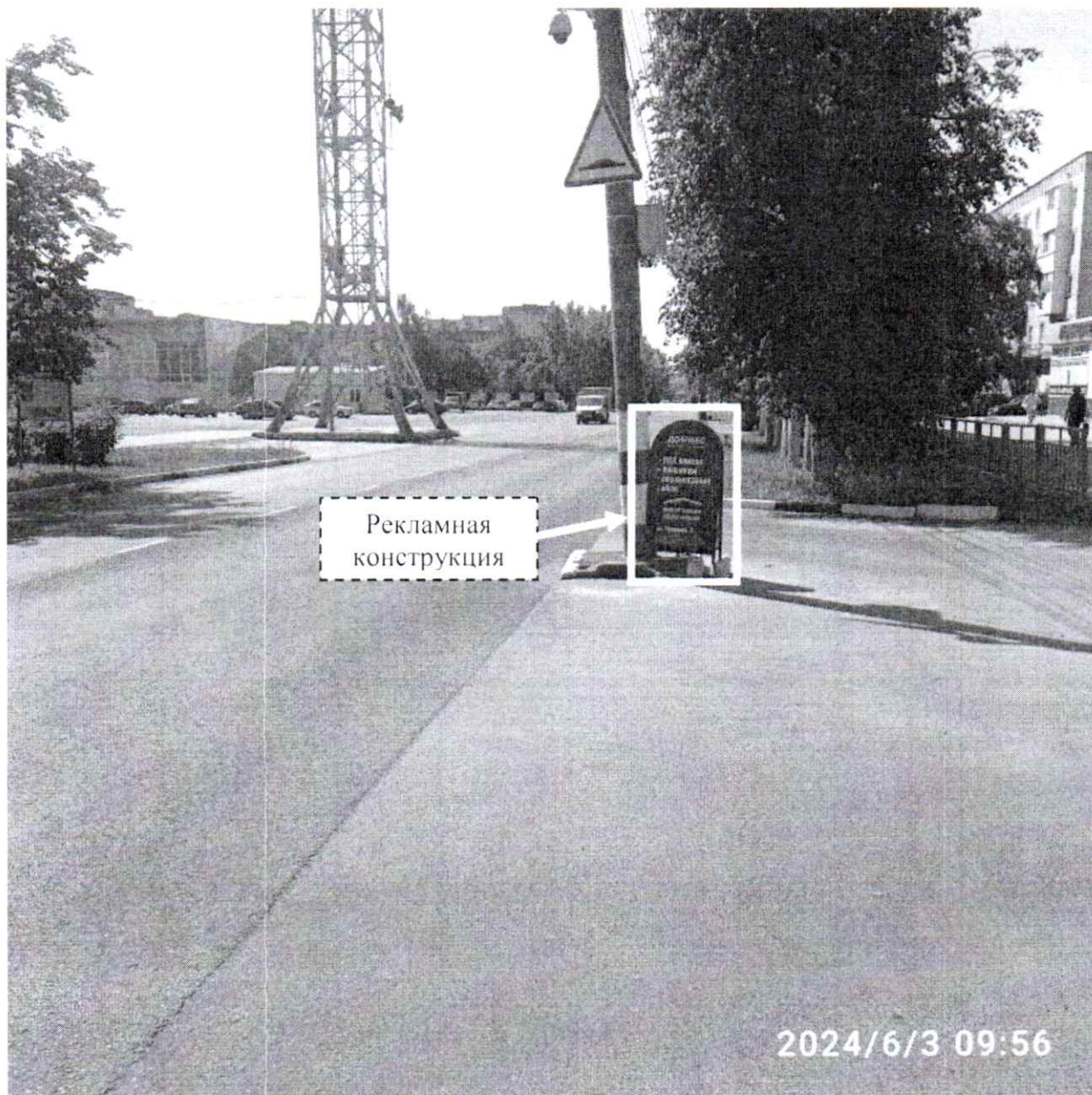
Фото № 1: Панорамный вид размещения рекламной конструкции (сторона А)

Фотофиксация рекламной конструкции размером 0,6 x 1,2 м с эскизным изображением на стороне А: «ДОМИКС ремонт доступен каждому - ПВХ плитка - линолеум - керамогранит - обои ВЫБОР больше ЦЕНЫ меньше ул. Урицкого, 2», на стороне Б: «ДОМИКС ремонт доступен каждому - ПВХ плитка - линолеум - керамогранит - обои ВЫБОР больше ЦЕНЫ меньше ул. Урицкого, 2», расположенной по адресу: г. Дзержинск, ул. Урицкого, в районе д. 4.