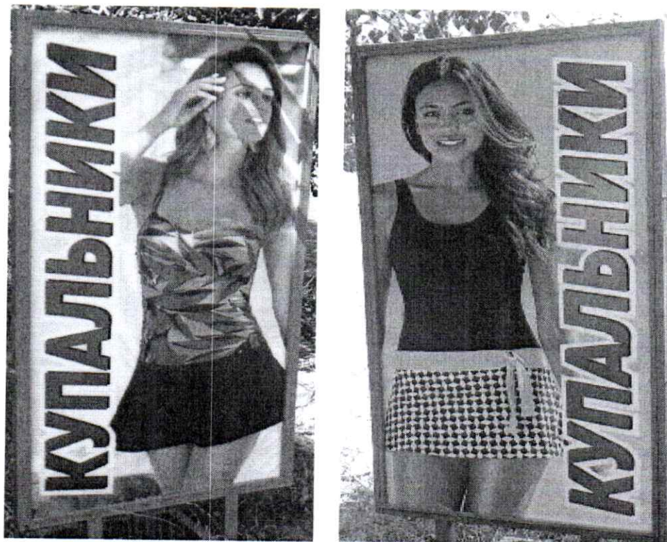
Фото № 2: Эскизное изображение рекламной конструкции (сторона А, сторона Б)