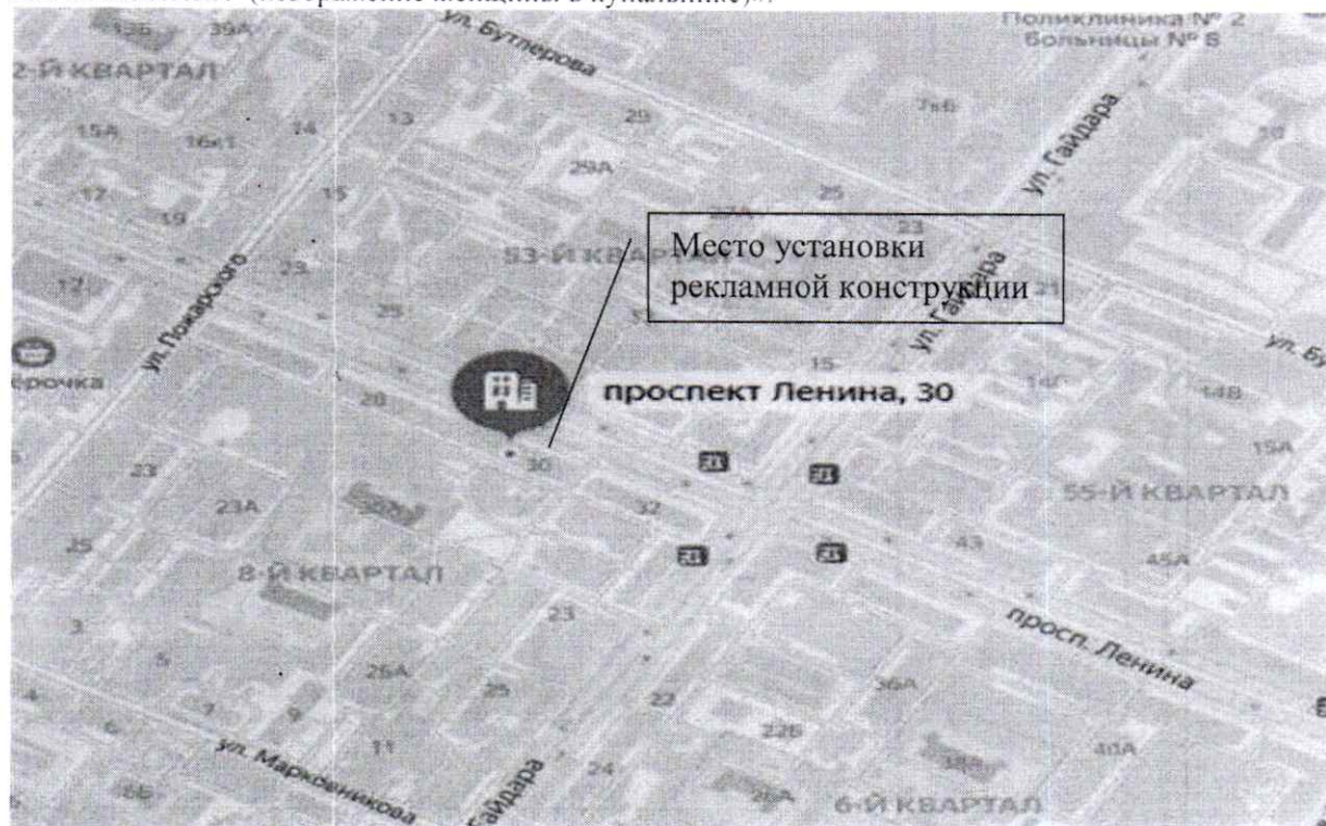
Схема установки (размещения) рекламной конструкции с эскизным изображением «КУПАЛЬНИКИ (изображение женщины в купальнике)»: