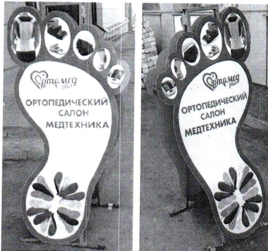
Фото № 2: Эскизное изображение рекламной конструкции (сторона А, сторона Б)