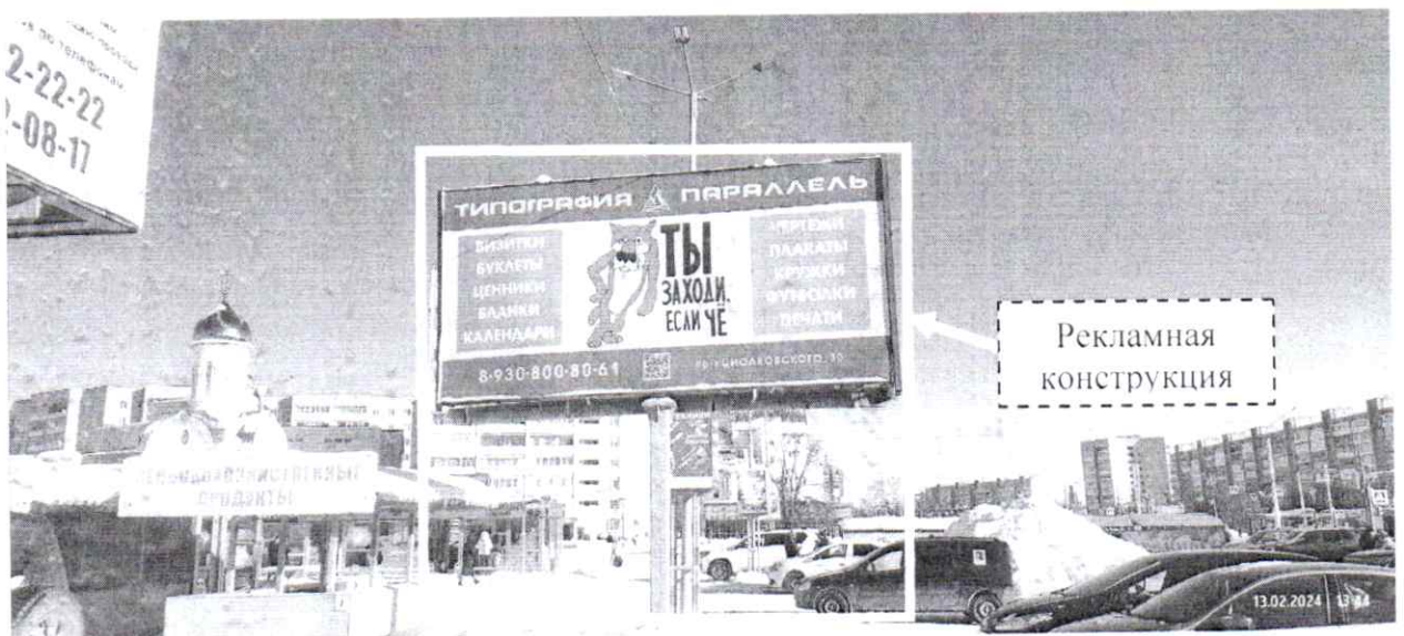
Фото № 2: Панорамный вид размещения рекламной конструкции (сторона Б)