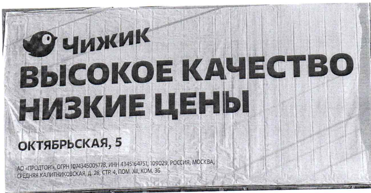
Фото № 2: Эскизное изображение рекламной конструкции (сторона Б).