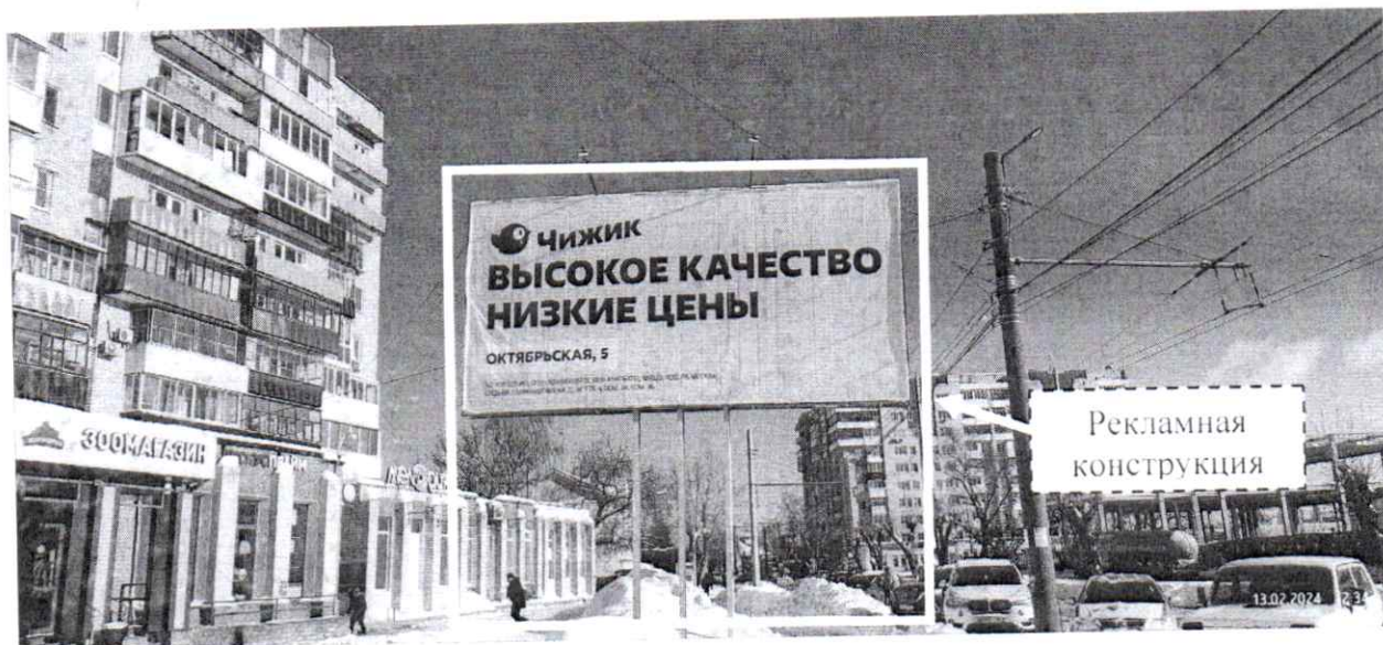
Фото № 1: Панорамный вид размещения рекламной конструкции (сторона Б)

Фотофиксация рекламной конструкции размером 6,0 x 3,0 м с эскизным изображением на стороне Б: «Чижик ВЫСОКОЕ КАЧЕСТВО НИЗКИЕ ЦЕНЫ», расположенной по адресу: г. Дзержинск, ул. Октябрьская, в районе д. 5.