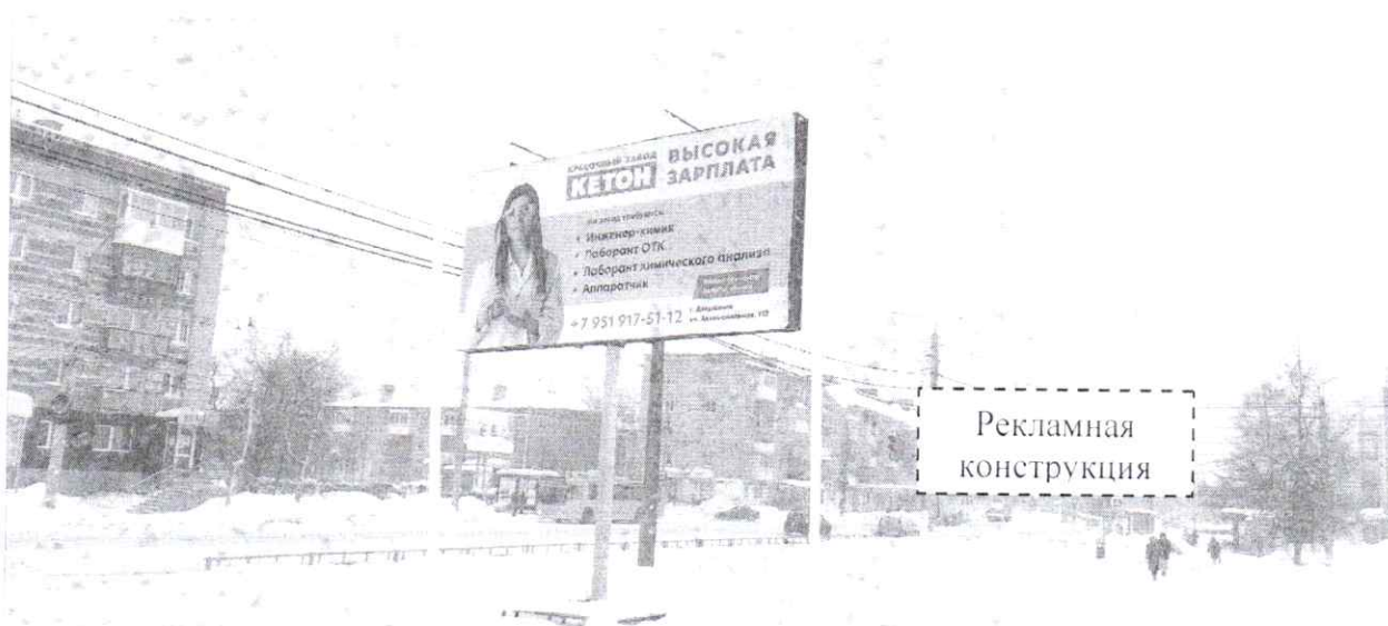
Фото № 1: Панорамный вид размещения рекламной конструкции (сторона А)

Фотофиксация рекламной конструкции размером 6,0 х 3,0 м с эскизным изображением на стороне А: «Красочный завод КЕТОН высокая зарплата На завод требуются: Инженер-химик Лаборант ОТК Лаборант химического анализа Аппаратчик +7 951 917-51-12», на стороне Б: «ARTZVEZDY.RU билеты от организатора ДК ХИМИКОВ начало в 19:00 4 апреля КИПЕЛОВ 20 ЛЕТ ГРУППЕ», расположенной по адресу: г. Дзержинск, ул. Гайдара, в районе д. 49.