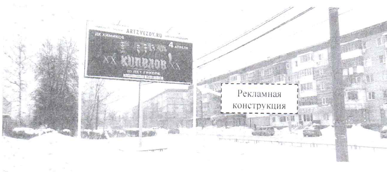
Фото № 2: Панорамный вид размещения рекламной конструкции (сторона Б)