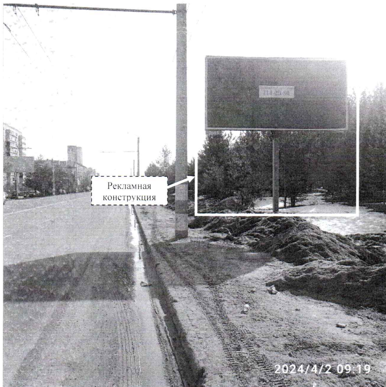
Фото № 1: Панорамный вид размещения рекламной конструкции (сторона А)

Фотофиксация рекламной конструкции размером 6,0 x 3,0 м с эскизным изображением на стороне А: «РАЗМЕЩЕНИЕ РЕКЛАМЫ 214-20-80», на стороне Б: «РАЗМЕЩЕНИЕ РЕКЛАМЫ 214-20-80», расположенной по адресу: г. Дзержинск, пр. Циолковского, д. 102 №2.