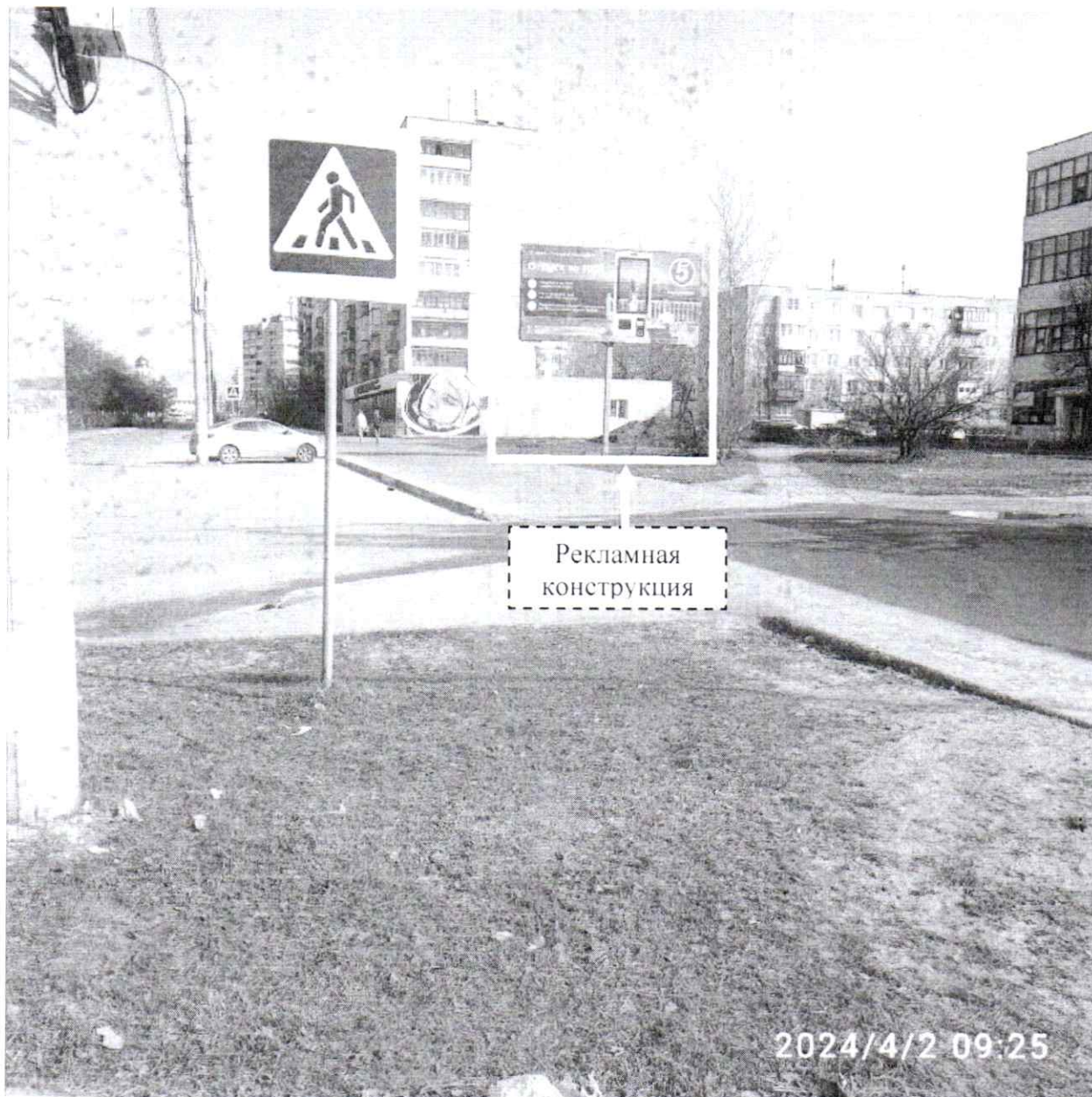
Фото № 1: Панорамный вид размещения рекламной конструкции (сторона А)

Фотофиксация рекламной конструкции размером 6,0 х 3,0 м с эскизным изображением на стороне А: «12 марта - 15 апреля Отпуск за 500 Р выручает!», на стороне Б: «СМОРОДИНА КВАРТИРЫ ОТ 4,3 МЛН Р СТАРТ ПРОДАЖ ДОМА №4», расположенной по адресу: г. Дзержинск, бул. Химиков, д. 7.