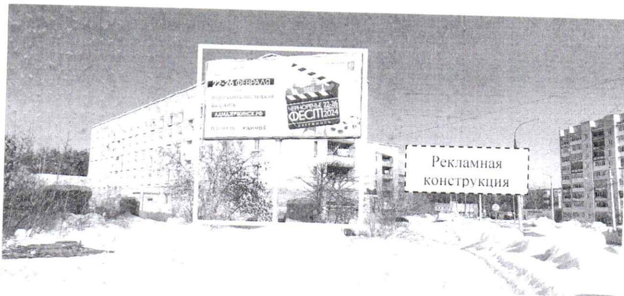
Фото № 2: Панорамный вид размещения рекламной конструкции (сторона Б)