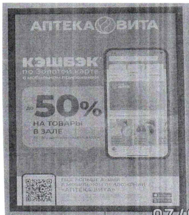
Фото № 2: Эскизное изображение рекламной конструкции