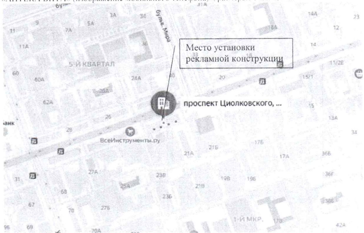
Схема установки (размещения) рекламной конструкции оранжевого цвета с эскизным изображением «аптека вита ВИТА КЭШБЭК по золотой карте в мобильном приложении до 50% на товары в зале по специальным ценникам кэшбэк в аптеке еще больше акций в приложении «АПТЕКА ВИТА» (изображение мобильного телефона)», размером 1 м x 0,4 м.: