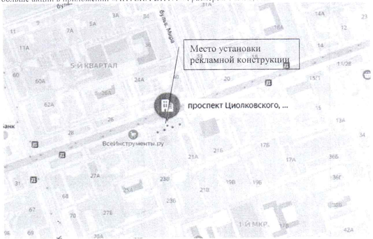
Схема установки (размещения) рекламной конструкции оранжевого цвета с эскизным изображением «АПТЕКА ВИТА ВИТА МИКС 1+1 бесплатно 2 любых товара по цене одного еще больше акций в приложении «АПТЕКА ВИТА»», размером 1 м x 0,4 м.: