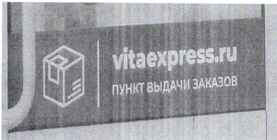
№ 2: Эскизное изображение рекламной конструкции