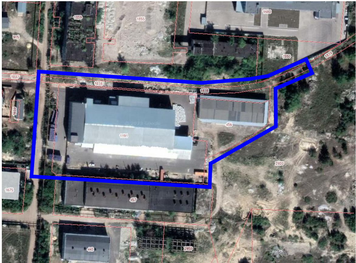
Схема границ подготовки документации по планировке территории