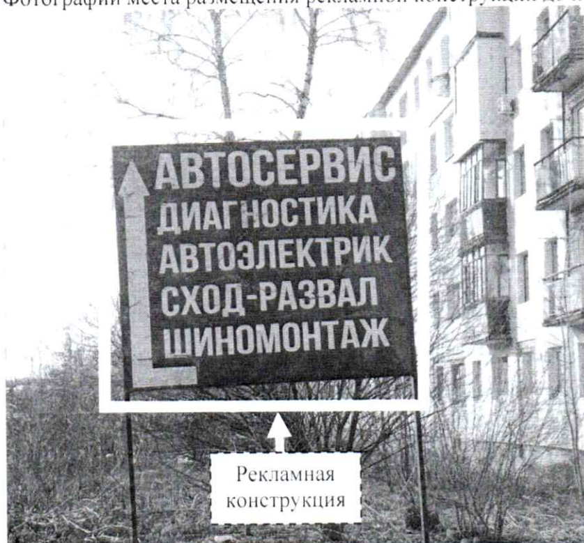
Фото № 1: ул. Октябрьская, в районе д. 80 – до проведения работ по демонтажу:

Фотографии места размещения рекламной конструкции до и после проведения работ: