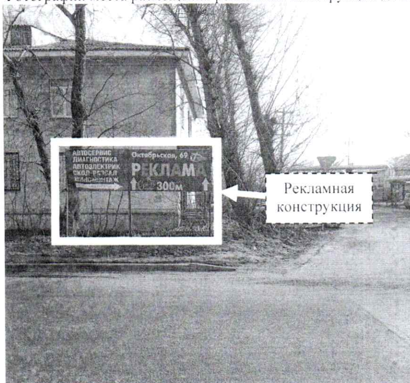
Фото № 1: ул. Студенческая, в районе д. 8А – до проведения работ по демонтажу.

Фотографии места размещения рекламной конструкции до и после проведения работ: