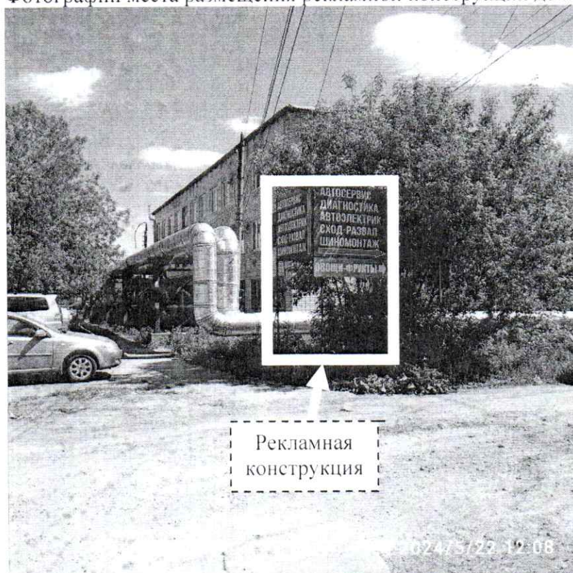
Фото № 1: ул. Октябрьская, в районе д. 82 – до проведения работ по демонтажу.

Фотографии места размещения рекламной конструкции до и после проведения работ: