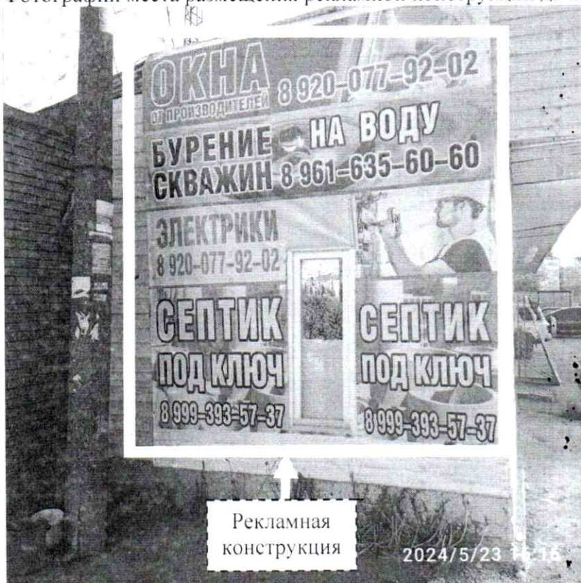
Фото № 1: пл. Привокзальная, д. 2В – до проведения работ по демонтажу.

Фотографии места размещения рекламной конструкции до и после проведения работ: