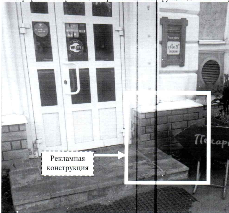
Фото № 1: Пр-т Ленина, д. 41 – до проведения работ по демонтажу.

Фотографии места размещения рекламной конструкции до и после проведения работ: