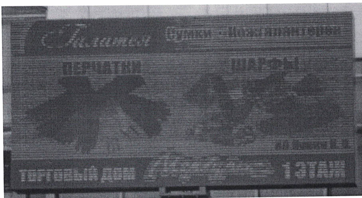
Фото №2: Эскизное изображение рекламной конструкции.