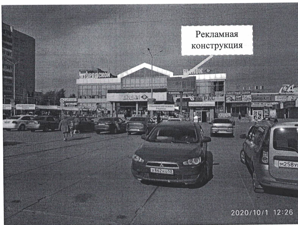
Фото № 1: Панорамный вид размещения рекламной конструкции.

Фотофиксация рекламной конструкции (электронный экран) с динамично изменяемым изображением, расположенной по адресу: Нижегородская обл., г. Дзержинск, пр. Циолковского, в районе д.78.