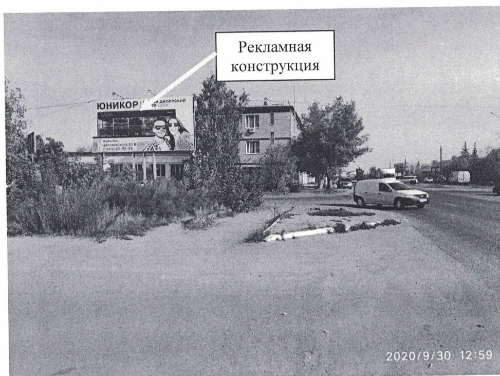
Фото №2: Эскизное изображение рекламной конструкции (сторона Б).

Схема размещения рекламной конструкции с эскизным изображением: