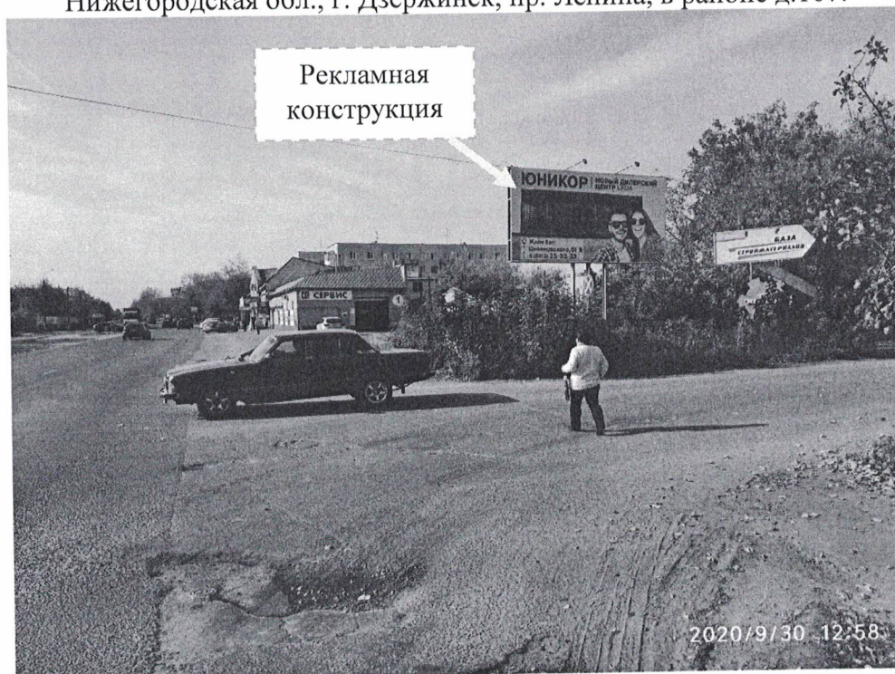
Фото № 1: Панорамный вид размещения рекламной конструкции (сторона А).

Фотофиксация рекламной конструкции с эскизным изображением : Сторона А - «Юникор. Новый дилерский центр LADA. Ждем вас: пр. Циолковского, д.61В. 8 (8313) 25-33-33» Сторона Б – «Юникор. Новый дилерский центр LADA. Ждем вас: пр. Циолковского, д.61В. 8 (8313) 25-33-33», расположенной по адресу: Нижегородская обл., г. Дзержинск, пр. Ленина, в районе д.107.