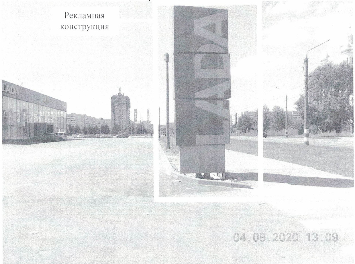
Фото № 1: Панорамный вид размещения рекламной конструкции.

Фотофиксация рекламной конструкции с эскизным изображением «LADA», расположенной по адресу: Нижегородская обл., г. Дзержинск, пр-т Циолковского, в районе д. 61В.