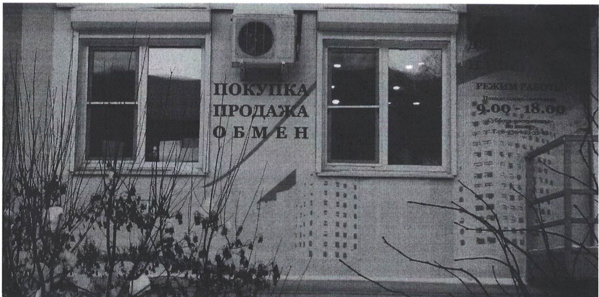
Фото № 2: Эскизное изображение рекламной конструкции