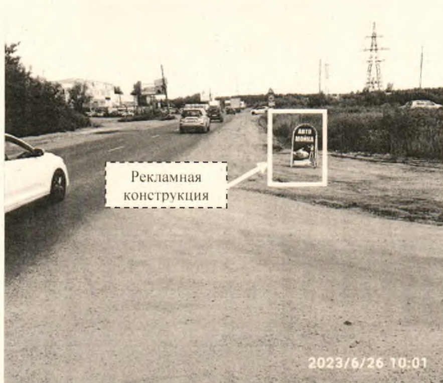
Фото № 1: Панорамный вид размещения рекламной конструкции (сторона А)

Фотофиксация рекламной конструкции размером 1,2 x 0,6 м с эскизным изображением «АВТО МОЙКА», расположенной по адресу: г. Дзержинск, пр. Ленина, в районе д. 1А.