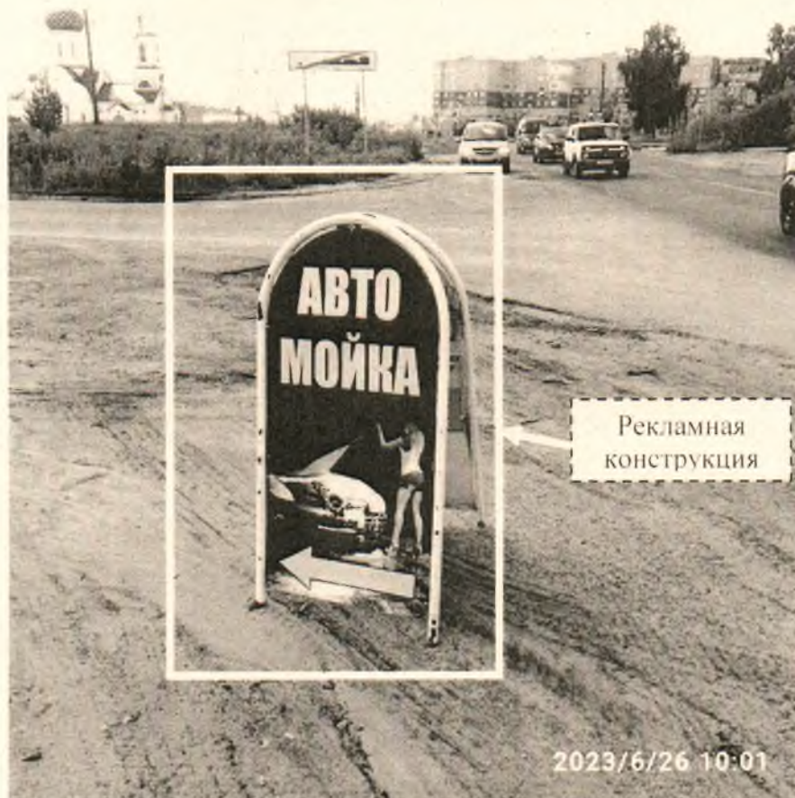
Фото № 2: Панорамный вид размещения рекламной конструкции (сторона Б)