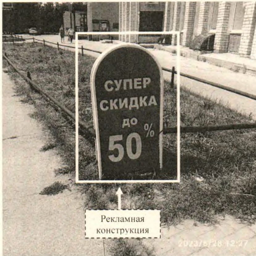
Фото № 1: Панорамный вид размещения рекламной конструкции (сторона А)

Фотофиксация рекламной конструкции размером 1,2 х 0,6 м с эскизным изображением «СУПЕР СКИДКА до 50%», расположенной по адресу: г. Дзержинск, ул. Октябрьская, в районе д. 5.