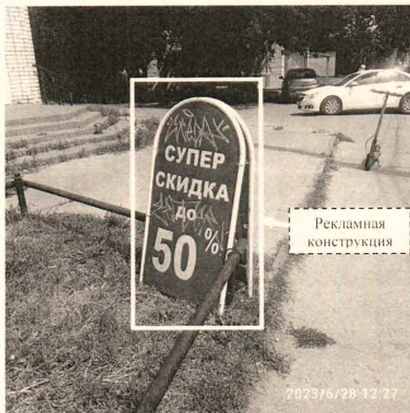
Фото № 2: Панорамный вид размещения рекламной конструкции (сторона Б)