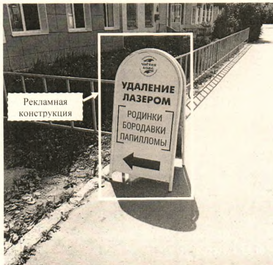
Фото № 2: Панорамный вид размещения рекламной конструкции (сторона Б)