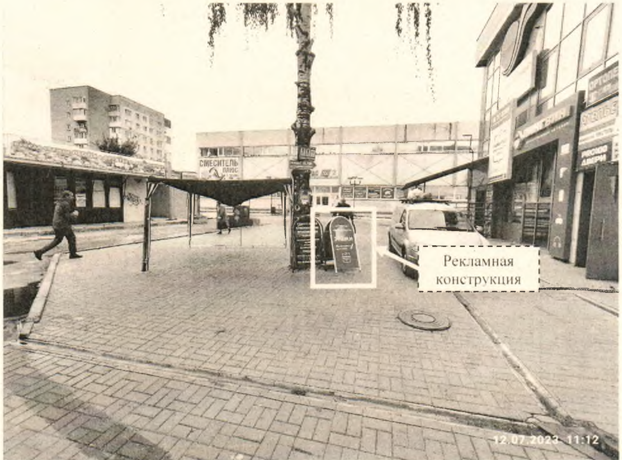
Фото № 1: Панорамный вид размещения рекламной конструкции (сторона А)

Фотофиксация рекламной конструкции размером 0,6 х 1,2 м с эскизным изображением «АГЕНСТВО НЕДВИЖИМОСТИ ЭТАЖИ Мы находимся на 2 этаже ГАРАНТИЯ безопасности сделки», расположенной по адресу: г. Дзержинск, ул. Гайдара, в районе д. 59Е.