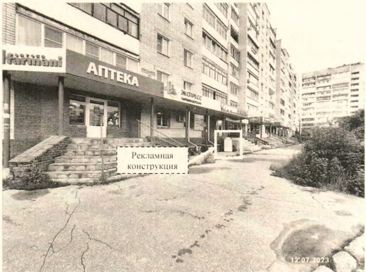
Фото № 1: Панорамный вид размещения рекламной конструкции (сторона А)

Фотофиксация рекламной конструкции размером 0,6 x 1,2 м с эскизным изображением сторона А: «СРОЧНО деньги 0% первый ЗАЁМ бесплатно!* 8-800-1001-363 www.srochnodengi.ru », сторона Б: «Срочно деньги ЗАЙМЫ с любой кредитной историей нужен только паспорт 8-800-1001-363 www.srochnodengi.ru », расположенной по адресу: г. Дзержинск, пр. Циолковского, в районе д. 74