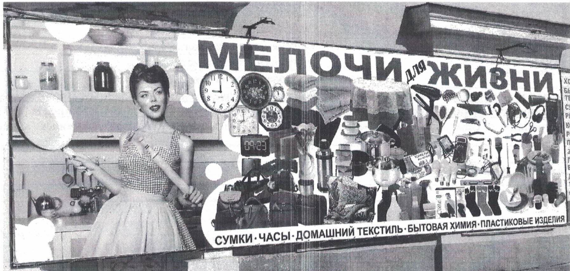
Фото № 2: Эскизное изображение рекламной конструкции