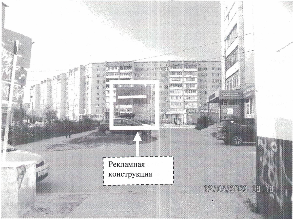
Фото № 1: Панорамное размещение рекламной конструкции, Сторона А.

Фотофиксация места установки (размещения) рекламной конструкции с эскизным изображением «Сторона А: 8-951-905-95-25 Сторона Б: 8-951-905-95-25».