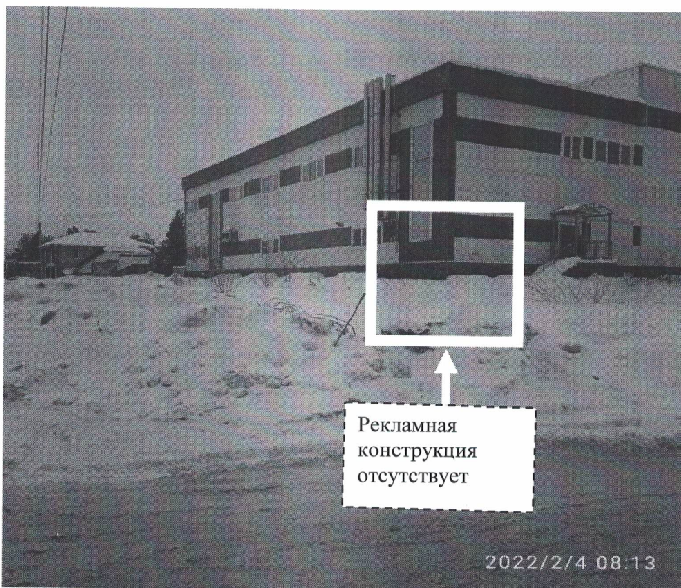
Фото №2: земельный участок г.Дзержинск пр.Свердлова в районе д.53А – после проведения работ по демонтажу