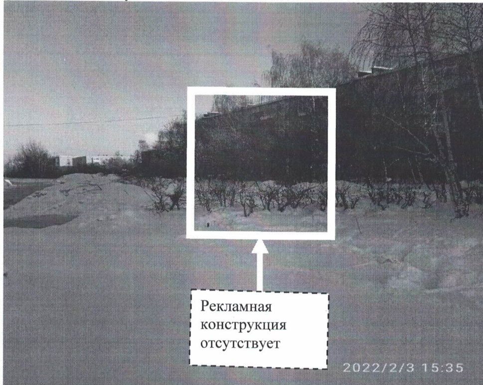
Фото №2: земельный участок г.Дзержинск пр.Свердлова в районе д.66/27 – после проведения работ по демонтажу