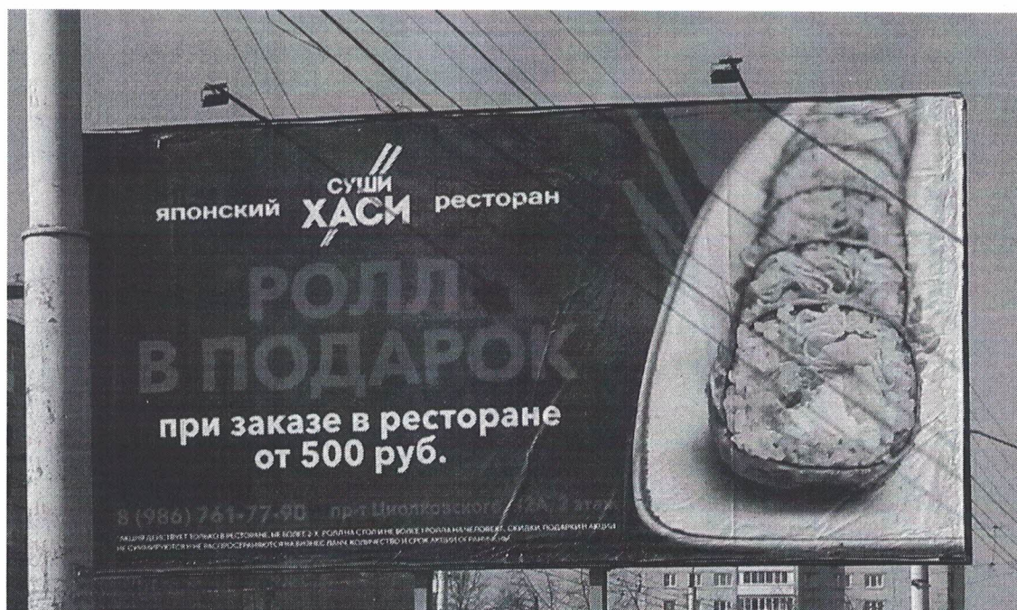
Фото № 2: Эскизное изображение рекламной конструкции, Сторона А.