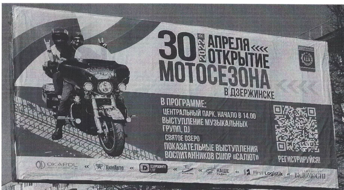
Фото № 2: Эскизное изображение рекламной конструкции, Сторона А.