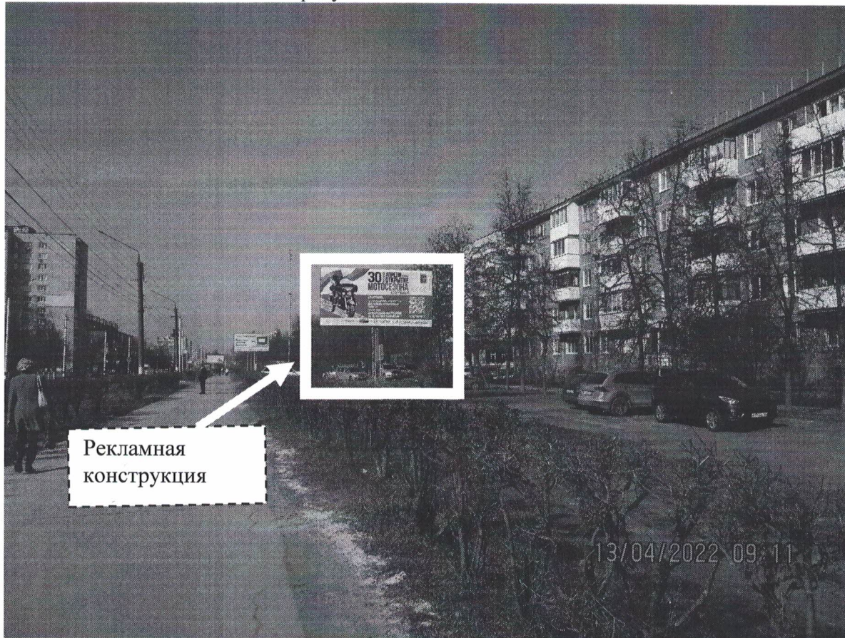
Фото № 1: Панорамное размещение рекламной конструкции.

Фотофиксация места установки (размещения) рекламной конструкции с эскизным изображением «Сторона А: 30 АПРЕЛЯ Открытие Мотосезона в Дзержинске В программе: Центральный парк. Начало в 14.00 Выступление музыкальных групп, DJ Святое озеро Показательные выступления воспитанников СШОР "САЛЮТ" Сторона Б: Дзержинские ведомости 15 лет с любовью к городу!»