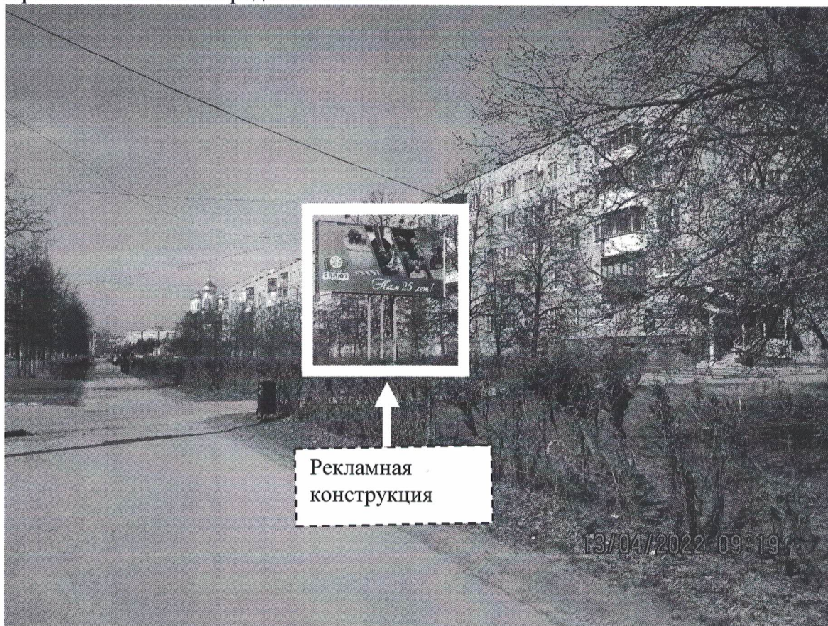
Фото № 1: Панорамное размещение рекламной конструкции.

Фотофиксация места установки (размещения) рекламной конструкции с эскизным изображением «Сторона А: СШОР САЛЮТ НАМ 25 ЛЕТ! Сторона Б: Соблюдай скоростной режим Ежегодно на дорогах области погибает около 400 человек! Правительство Нижегородской области»