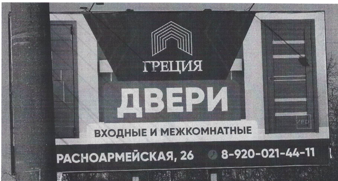
Фото № 2: Эскизное изображение рекламной конструкции, Сторона А.