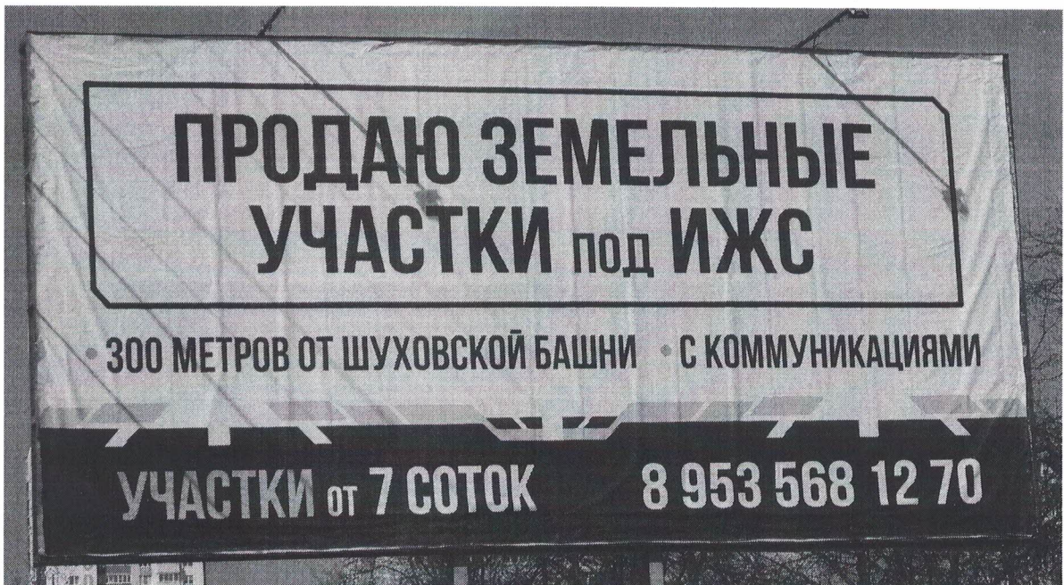
Фото № 2: Эскизное изображение рекламной конструкции, Сторона А.